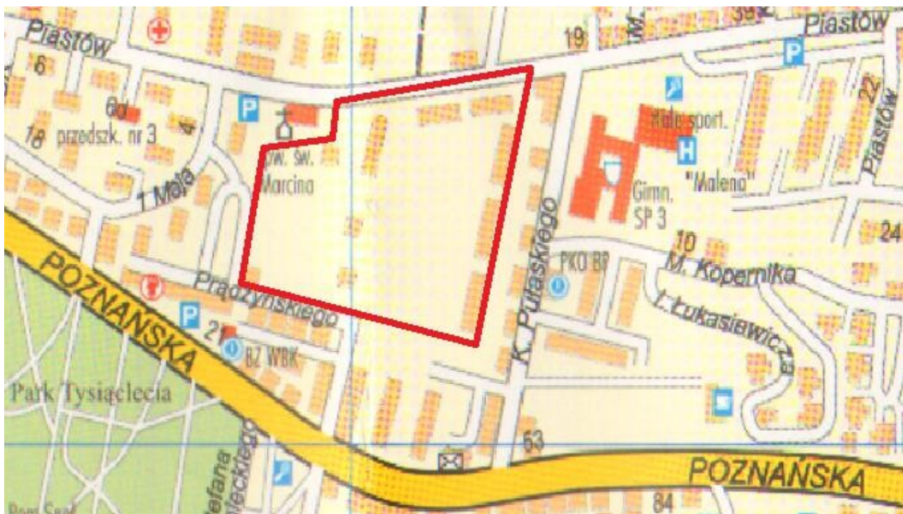
Rys. 1 Lokalizacja zdegradowanego obszaru powojskowego – Plac 11 Pułku / ul. Piastów w Krośnie Odrzańskim

Zgodnie z Wytycznymi do tworzenia Lokalnych Programów Rewitalizacji dla Województwa Lubuskiego na lata 2007-2013 obszar powojskowy jest automatycznie traktowany jako obszar zdegradowany 4 . Beneficjent jest zobligowany do udokumentowania, że teren ten miał wcześniej takie przeznaczenie, tj., że na obszarze tym stacjonowały jednostki wojskowe (oświadczenie potwierdzające wcześniejsze przeznaczenie terenu oraz wypis z księgi wieczystej lub aktu notarialnego).