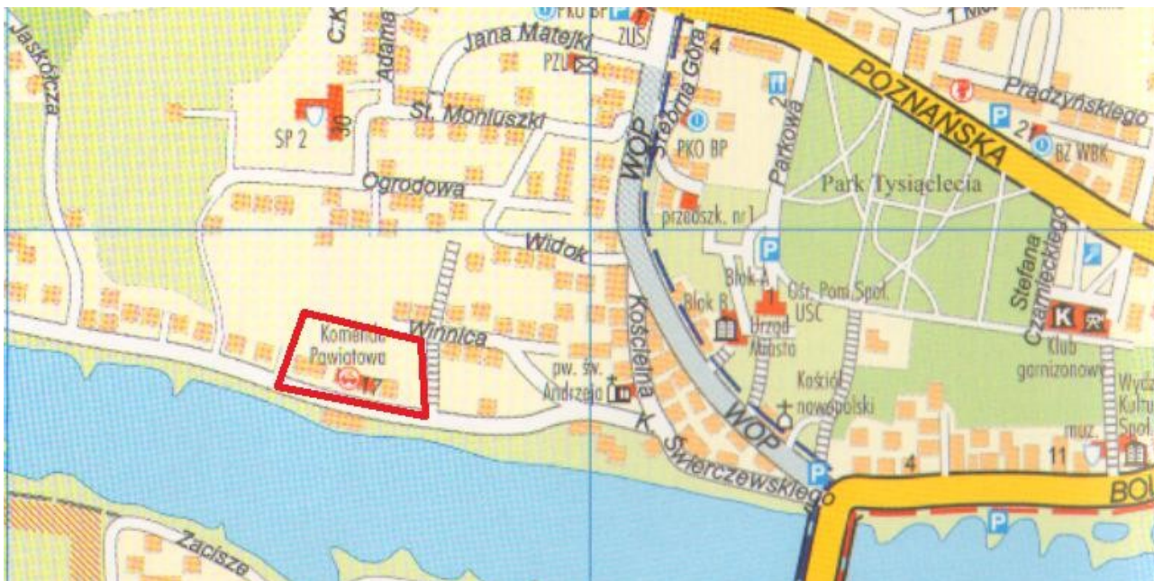
Rys. 4 Lokalizacja zdegradowanego obszaru miejskiego – ul. Świerczewskiego w Krośnie Odrzańskim

Teren ten stanowi zdegradowany obszar miejski ze względu na przekroczenie wartości referencyjnych dla następujących kryteriów: