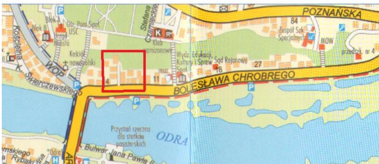
Rys. 2 Lokalizacja zdegradowanego obszaru miejskiego – ul. Chrobrego w Krośnie Odrzańskim

Teren ten stanowi zdegradowany obszar miejski ze względu na przekroczenie wartości referencyjnych dla następujących kryteriów: