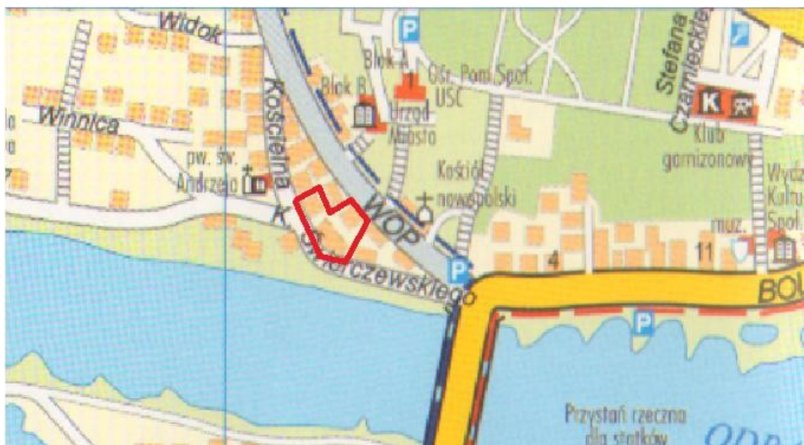
Rys. 3 Lokalizacja zdegradowanego obszaru miejskiego – ul. WOP / ul. Kościelna w Krośnie Odrzańskim