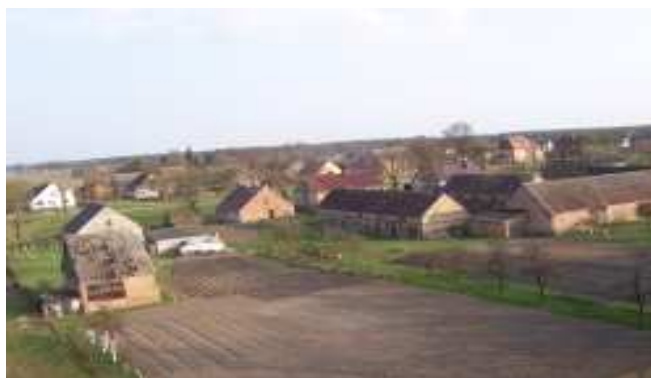
Fot. Widok z wieży Kościoła

- Zabytki - Do osobliwości Lemierzyc należy XIX-wieczny kościół parafialny pw. Apostołów św. Piotra i Pawła.