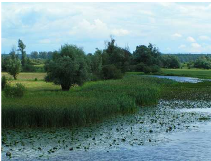
Fot. Starorzecze Warty

Lasy - W 1970r na powierzchni 3,32 ha utworzono rezerwat leśny "Lemierzyce". Chroni on fragmenty dobrze wykształconego, wielogatunkowego lasu liściastego, o naturalnym charakterze, porastającego teren o urozmaiconej rzeźbie nad brzegami Postomii, Dominuje tu dąb i buk, występuje również klon, grab, jawor, wiąz, lipa drobnolistna, brzoza brodawkowata, sosna zwyczajna, modrzew europejski, daglezie. Rezerwat graniczy od północy z rzeką Postomią i bagnem, od zachodu z powierzchnią leśną, od południa z gruntami ornymi i osadą N-ctwa oraz na długości 90 m z gruntami wsi Lemierzyce. Rezerwat stanowi fragment naturalnego lasu mieszanego, porastającego strome zbocze. Drzewostan jest wielopiętrowy, w I-szym piętrze występują olchy, buki, w wieku około 175 lat. Zmieszanie kępowe i jednostkowe. W rezerwacie występuje szereg drzew o charakterze pomnikowym. Podszyt tworzy bez czarny, buk, tawuła, czeremcha, berberys, leszczyna, sporadycznie cis. W runie: konwalia, zawilec, fiołek, glistnik jaskółcze ziele, narecznica, kokoryczka, niecierpek, jastrzębiec, trawy.