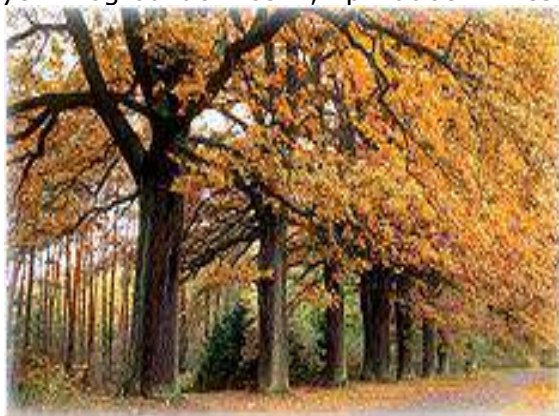
Plan Odnowy Miejscowości Lemierzycy

Opis krajobrazu dolin nie byłby także pełen, gdyby nie wspomnieć o charakterystycznej roślinności dawnych, opuszczonych po II wojnie siedlisk ludzkich. Ich miejsca wyznaczają skupienia bżów, kępy dawniej uprawianych w ogródkach roślin, np. rudbekii i festony dzikiego wina.