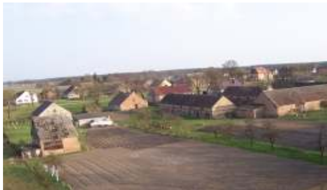
Fot. Widok z wieży Kościoła

- Zabytki - Do osobliwości Lemierzyc należy XIX-wieczny kościół parafialny pw. Apostołów św. Piotra i Pawła.