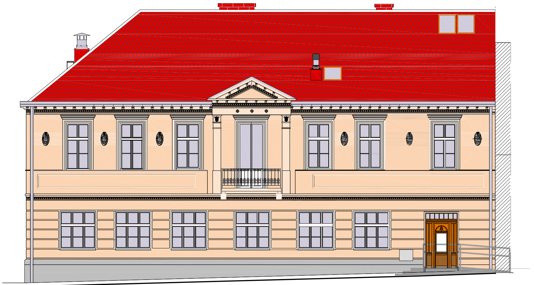
ELEWACJA FRONTOWA WSCHODNIA