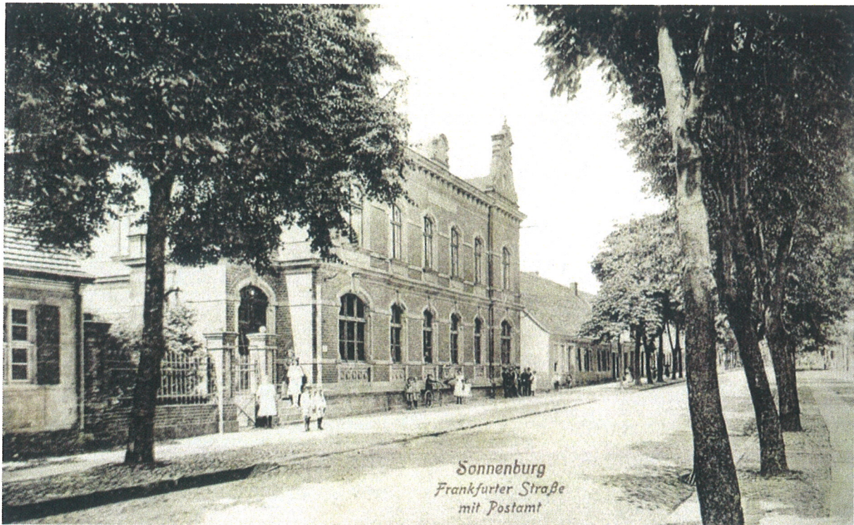
Fot. 1. Archiwalne zdjęcie z widocznym budynkiem dawnej poczty

ul. Lipowa 18a, 69-200 Sulęcín tel. 95 755 52 43 do 46, fax 95 755 55 57 Regon 210466902, NIP 429-00-70-240