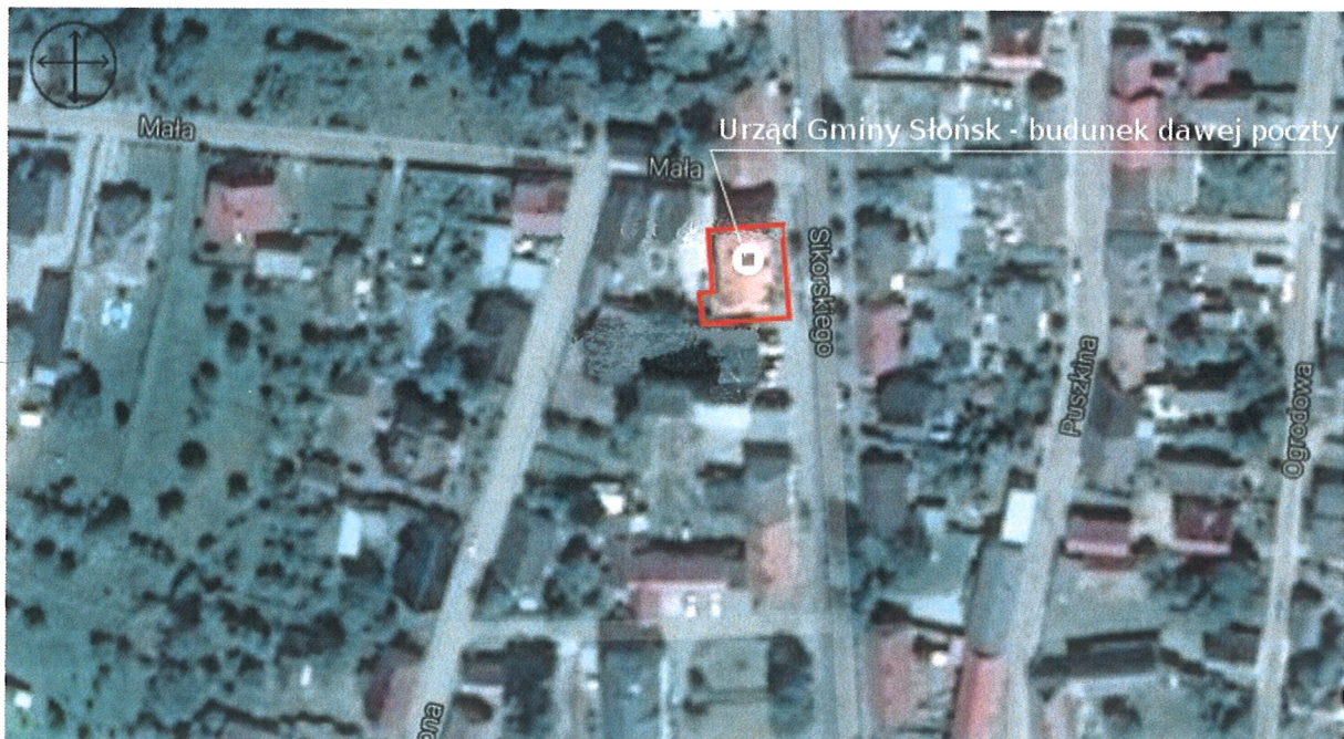
Fot. 2. Fragment planu Słońska z zaznaczonym budynkiem urzędu.