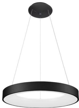
GIULIA LAMPA WISZĄCA