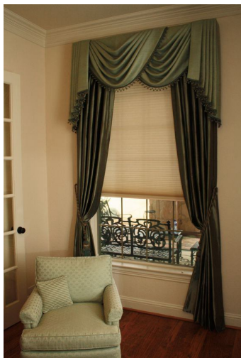
GABINETY WÓJTA i Z-CY