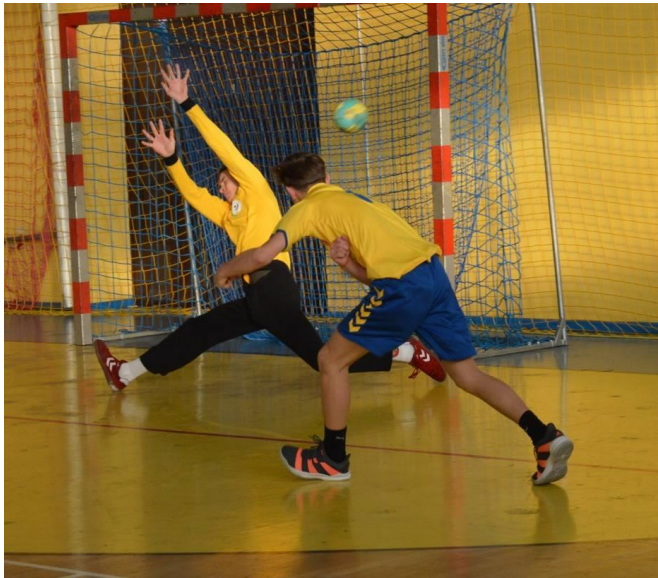
Stowarzyszenie Sportowe „Zjednoczeni” Lubrza