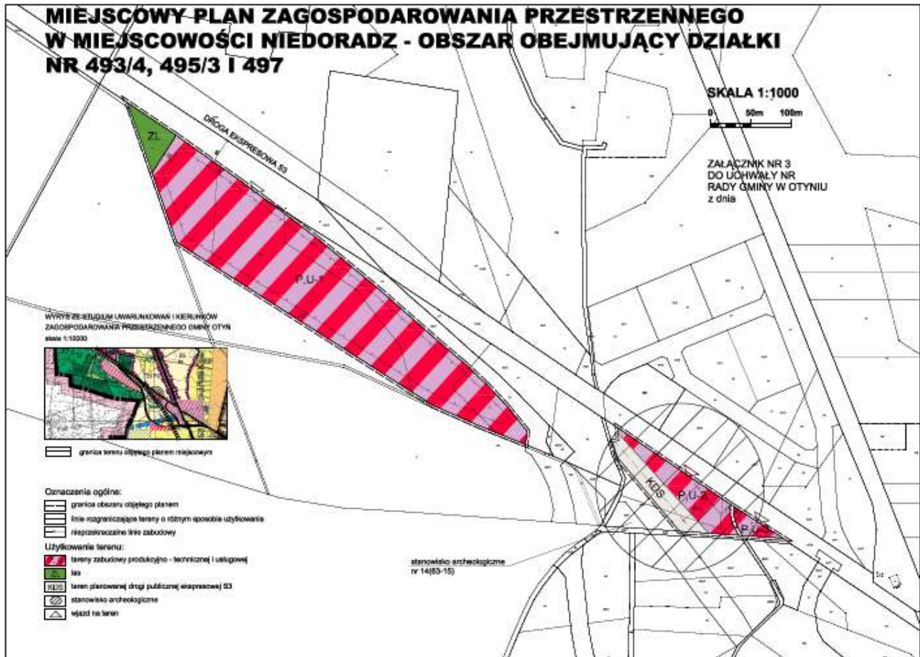
Mapa Nr 3

Załącznik Nr 4 do uchwały Nr VI.44.2011 Rady Gminy w Otyniu z dnia 27 maja 2011r.