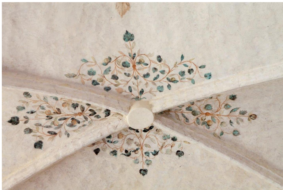
Fragment sklepienia prezbiterium kościoła parafialnego p.w. Narodzenia NMP w Chotkowie po pracach konserwatorskich wykonanych w 2016 r. – dotacja MKIDN

Witryna internetowa: www.powiatzaganski.pl .