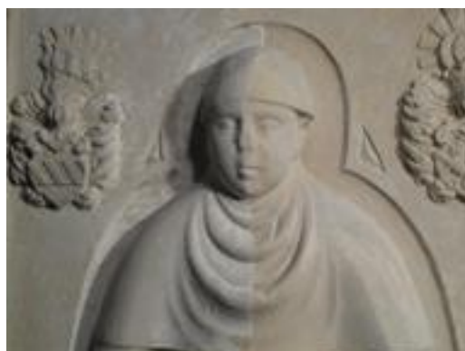
Płyta nagrobna dziecka (XVI w.) z kościoła p.w. Narodzenia NMP w Chotkowie w trakcie prac konserwatorskich 2016 r. (prace dofinansowano ze środków MKiDN)