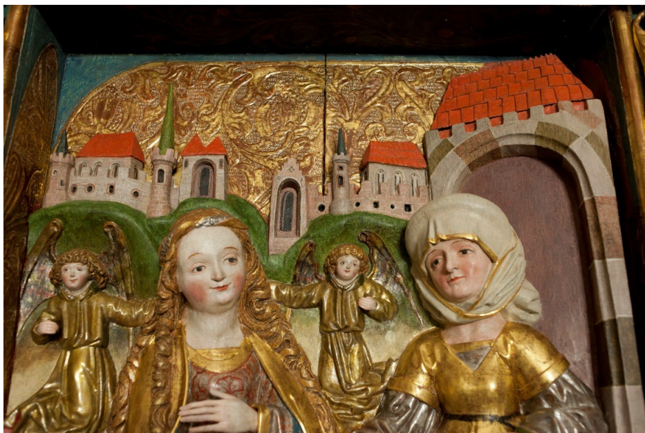
Fragment zachowanego skrzydła tryptyku Mistrza z Gościeszowic (XV w.) z kościoła parafialnego p.w. Narodzenia NMP w Chotkowie (po konserwacji - dotacja WLKZ), obecnie (tymczasowo) eksponowane w kościele parafialnym p.w. Marii Magdaleny w Brzeźnicy. (Fot. Pracownia Konserwacji - Toruń)