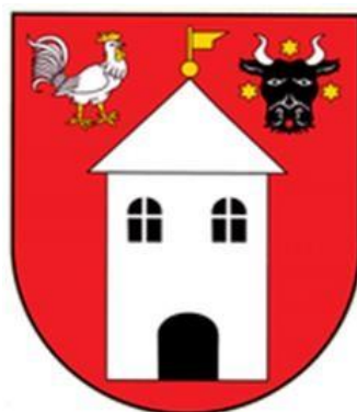
Rysunek 1 – Herb Gminy Brzeźnica

Sytuacja zmieniła na terenie Gminy zmieniła się po II Wojnie Światowej. Po wyjeździe ludności niemieckiej, wieś zaczęli zasiedlać przybysze z różnych części Polski. Dziś (31.12.2018 r.) na terenie Gminy mieszkają 3795 osoby.