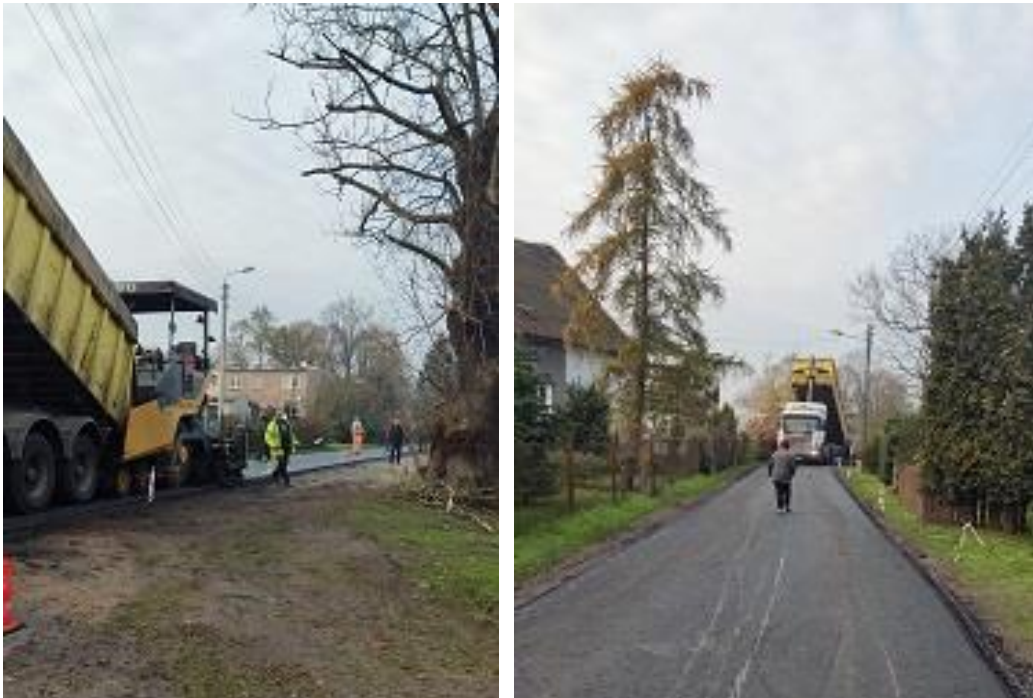
Fot. 11,12 - Przebudowa drogi w Jabłonowie.