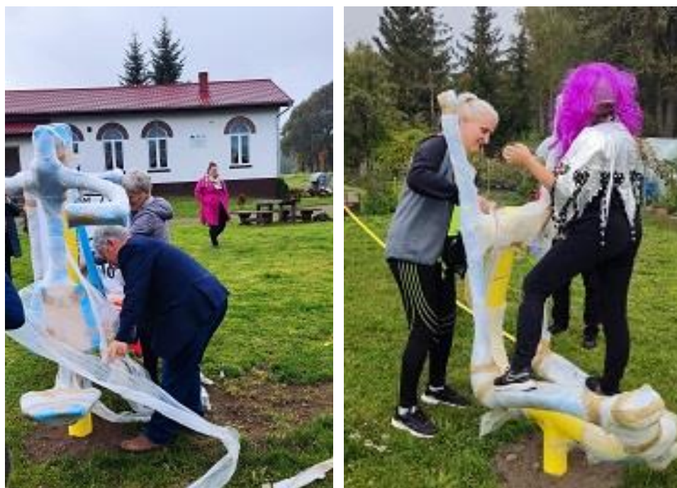
Fot. 5,6 - Otwarcie placu zabaw w Przylaskach zrealizowanego w ramach programu LGD „Działaj Lokalnie”