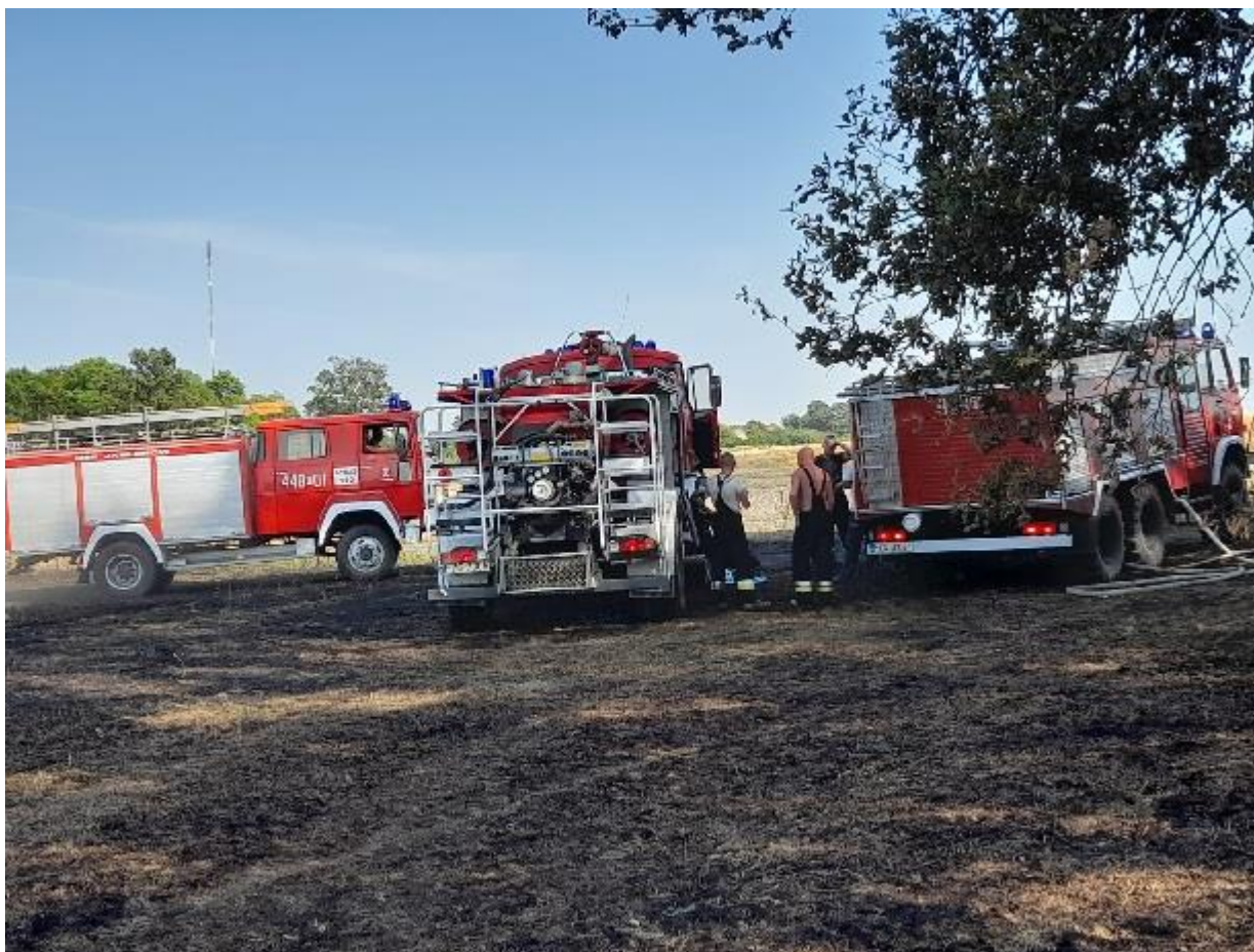
Fot. 21-23 - Działania gminnych jednostek OSP.