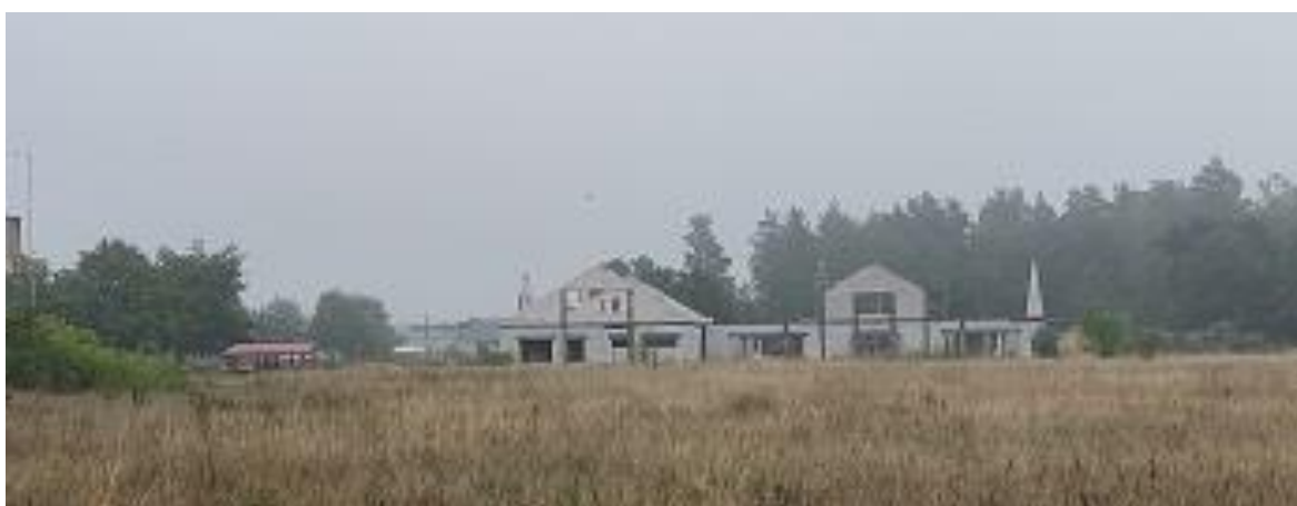
Fot. 27 -29 - Budowa Centrum Kultury Górali Bukowińskich w Brzeźnicy.