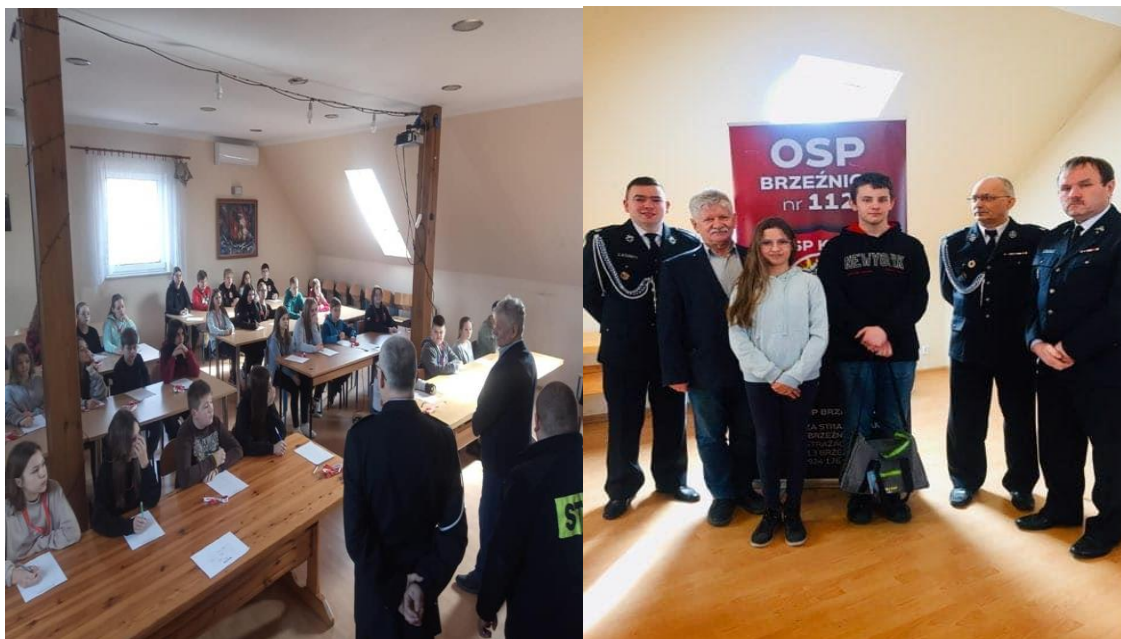
Fot. 17-20 - Gminy Turniej Wiedzy Pożarniczej Szkół Podstawowych.

Jednostki OSP w ramach pozyskiwania funduszy na realizację swoich zadań pozyskali środki finansowe w ramach Lubuskiej Odnowy Wsi, programu MAŁY STRAŻAK oraz środki z WFOŚ. Pozyskane środki finansowe przeznaczone zostały na zakup sprzętu i umundurowania.