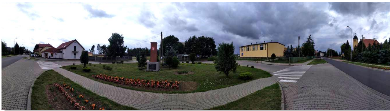
Fot. 1 – Panorama Brzeźnicy

Raport podsumowuje działalność samorządu gminnego w roku poprzednim. Zakres opracowanego dokumentu obejmuje przede wszystkim realizację polityk, programów, strategii, uchwał rady gminy oraz budżetu. Informacje zawarte w niniejszym dokumencie posłużą mieszkańcom gminy Brzeźnica do zwiększenia wiedzy na temat funkcjonowania samorządu gminnego. Elementem nieodzownym raportu jest sprawozdanie finansowe z realizacji budżetu Gminy za 2022 r., przedłożone Radzie Gminy.