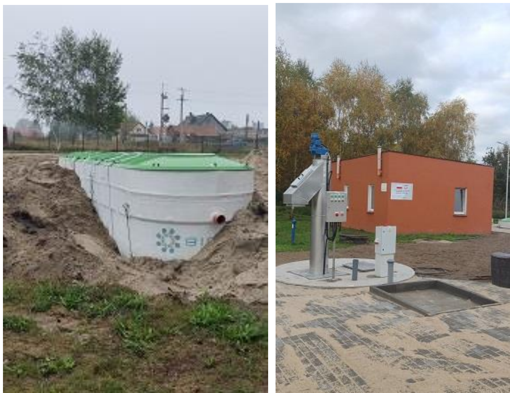
Fot. 31,32 - Nowa oczyszczalnia ścieków w Brzeźnicy.

Należności od odbiorców z tytułu dostarczanej wody i odprowadzonych ścieków na koniec 2022 roku wyniosły 92 008,06 zł.