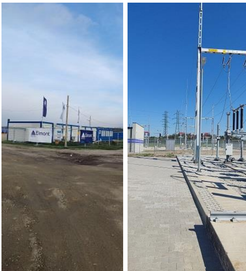
Fot. 3,4 - Budowa farmy fotowoltaicznej w Chotkowie.

Podmioty gospodarcze funkcjonujące na terenie gminy to przede wszystkim małe i średnie zakłady rodzinne. Do wiodących branż w gminie zaliczyć należy: usługi sprzątanie budynków i obiektów przemysłowych, usługi budowlane, transport drogowy, sprzedaż detaliczna i handel, naprawa i konserwacja maszyn.