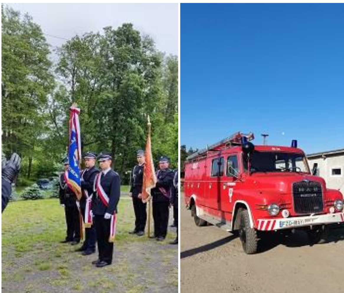
Fot. 15,16 - OSP Przylaski.

Co roku młodzież z Szkół Podstawowych bierze udział w Ogólnopolskim Turnieju Wiedzy Pożarniczej na szczeblu gminy. Turniej cieszy się bardzo dużym zainteresowaniem młodzieży, średnio uczestniczy ok. 60 uczniów ze wszystkich szkół podstawowych.