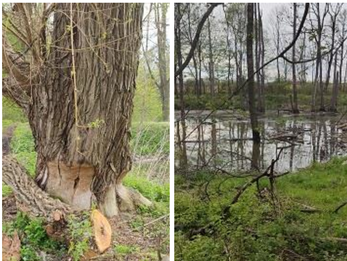
Fot. 35,36 - Efekty „pracy” bobrów

W budżecie Gminy Brzeźnica w roku 2022 była zabezpieczona kwota 15 500,00 zł na realizację zadań z zakresu opieki nad zwierzętami bezdomnymi oraz zapobiegania bezdomności zwierząt na terenie Gminy Brzeźnica.