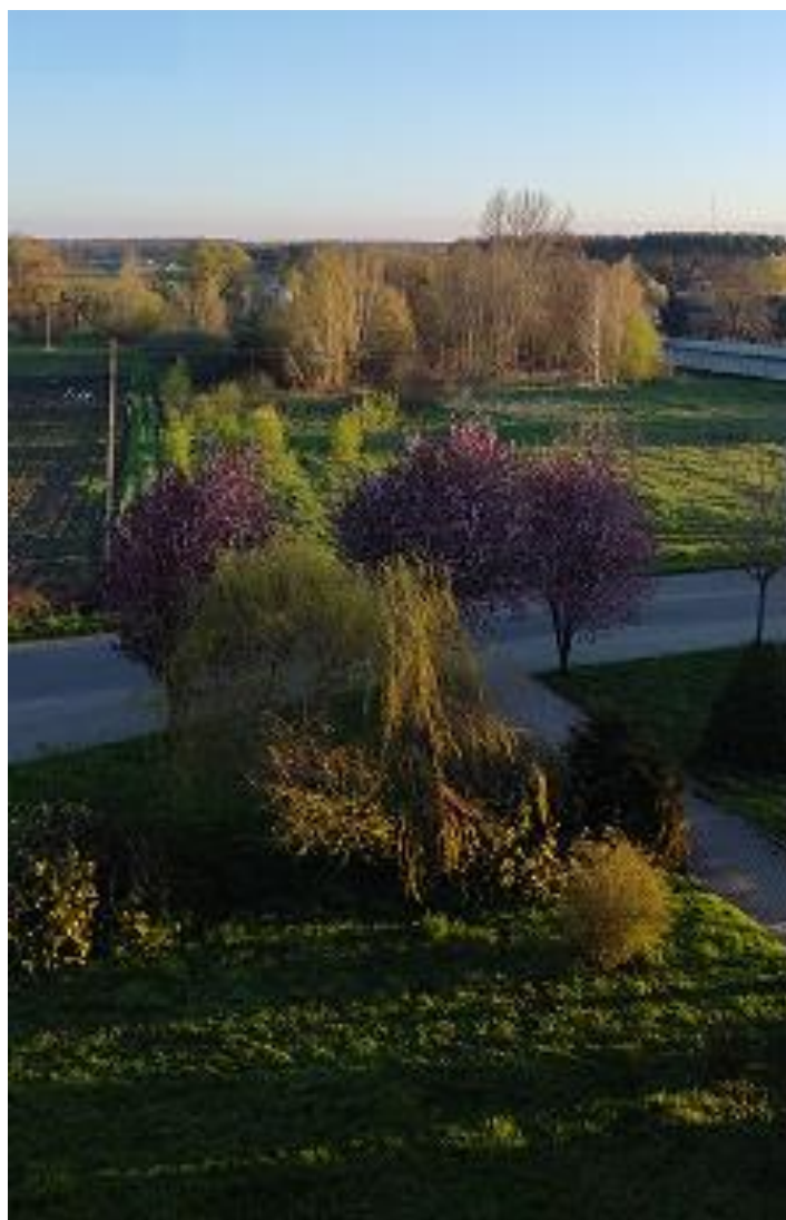
Fot.2 - Wiosna w Chotkowie