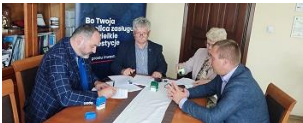
Fot. 7 - Podpisanie umowy na „Budowę kanalizacji sanitarnej i oczyszczalni ścieków w miejscowości Jabłonów”.