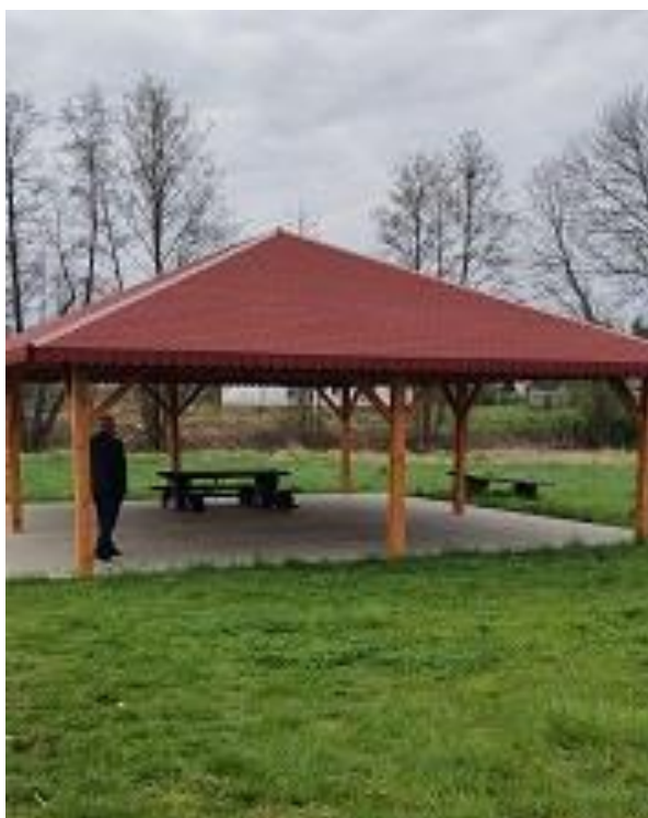
Fot. 34 - Wiała rekreacyjna w Brzeźnicy.

Dzięki zaangażowaniu klubu sportowego w Brzeźnicy, przy finansowym wsparciu gminy zmodernizowano miejscowe boisko do piłki nożnej i wyremontowano szatnie. W Brzeźnicy przy finansowym wsparciu Urzędu Marszałkowskiego i Gminy jest zainstalowany system nawodnienia murawy. Doskonałym miejscem rekreacji są ogólnodostępne place zabaw dla dzieci. Place zostały w większości wykonane przez mieszkańców wsi ze środków zewnętrznych: z LGD przy finansowym wsparciu Gminy i Urzędu Marszałkowskiego w Zielonej Górze. Do wykonania pozostały place zabaw w najmniejszych miejscowościach w Marcinowie i Stanowie. Na placu zabaw w Brzeźnicy i Jabłonowie ustawione są urządzenia do ćwiczeń dla dorosłych.