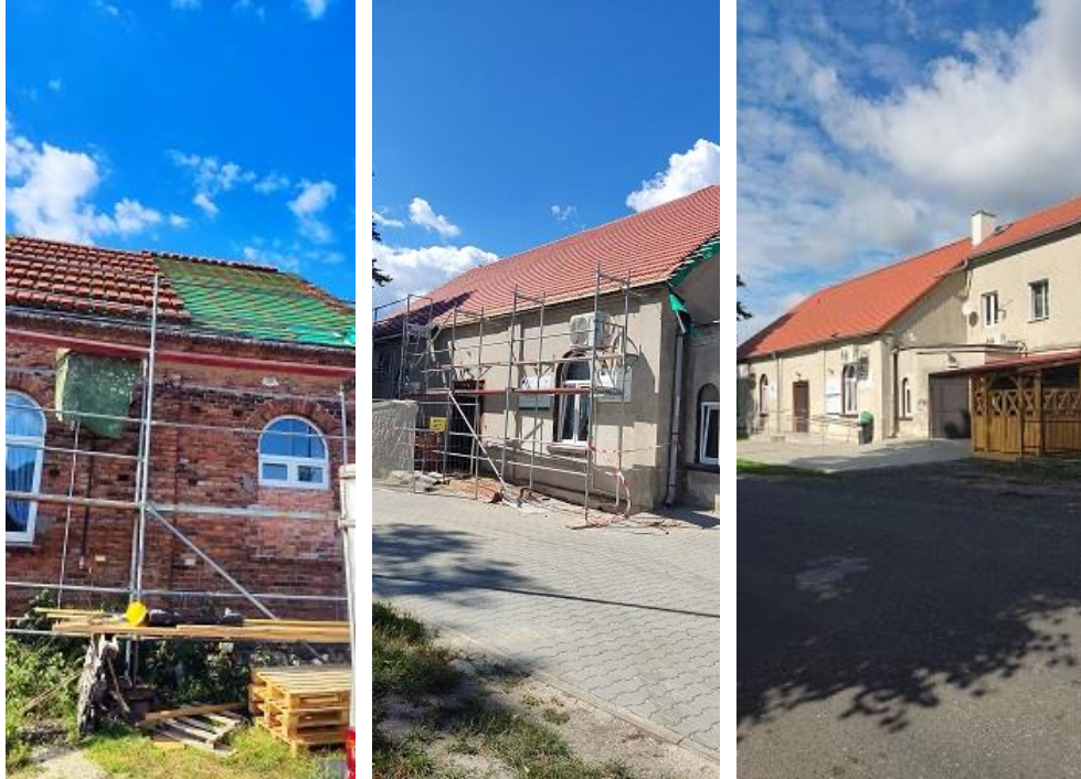
Fot. 8,9,10 - Remont świetlicy we Wrzesinach.