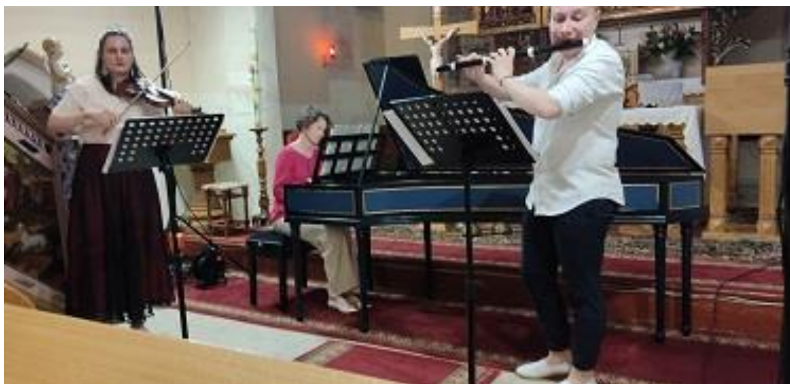
Fot. 33 - Koncert zespołu Green Kore w ramach projektu Przedsionek Raju w kościele parafialnym w Brzeźnicy.

Systematycznie biblioteki są odwiedzane przez uczniów naszych szkół z terenu gminy. Odwiedziły nas również dzieci z przedszkola w Żaganii.