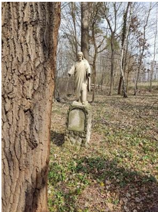
Fot. 13 - Zabytkowy cmentarz

275 stanowisk archeologicznych oraz 223 zabytki ruchome wpisane do rejestru zabytków ruchomych województwa lubuskiego które stanowią wyposażenie kościołów. W roku 2022 r. nie były wyodrębnione środki na opiekę nad zabytkami.