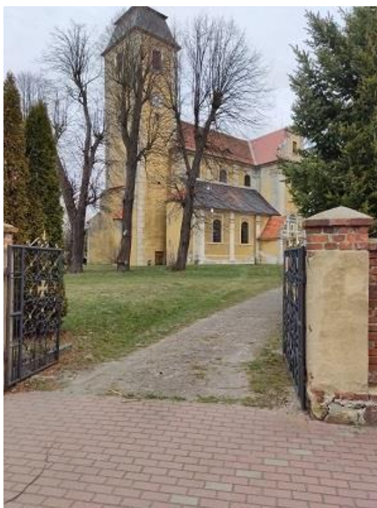
Fot. 14 - Parafialny kościół pw. św. Marii Magdaleny w Brzeźnicy.