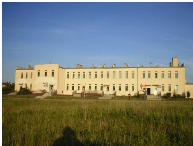
Zdjęcie 6: Ośrodek Zdrowia w Brzeźnicy