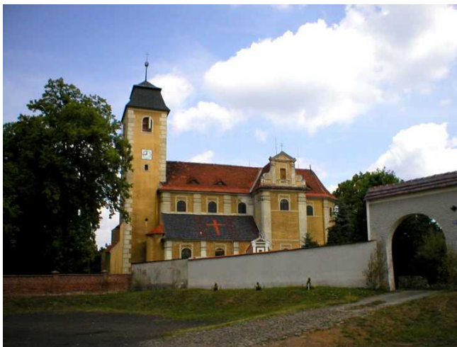
Zdjęcie 4. Widok kościoła wraz z bramą wjazdową na plebanię