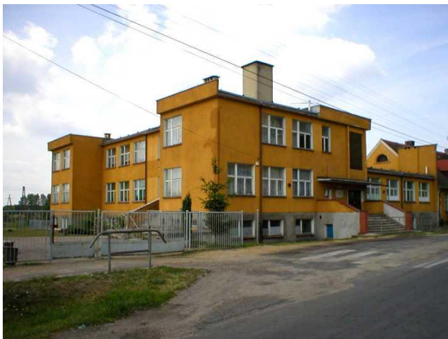
Zdjęcie 2. Zespół Szkół w Brzeźnicy