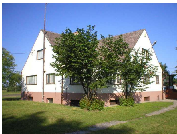
Zdjęcie 1. Budynek Urzędu Gminy