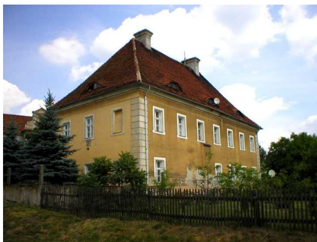
Zdjęcie 5: Widok plebanii od strony południowej