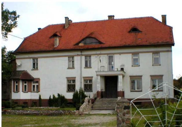
Zdjęcie 7: Pałac z XIX w.