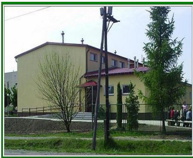
Zdjęcie 3: Sala gimnastyczna przy Zespole Szkół