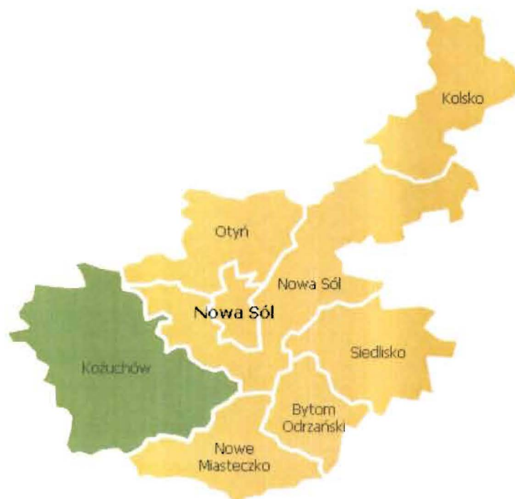
Rysunek 1. Gmina Koźuchów w powiecie nowosolskim

Gmina Koźuchów zajmuje powierzchnię 179 km 2 i położona jest w zachodniej części powiatu nowosolskiego. Jednostka stanowi 23 % powierzchni powiatu. Według danych z 2013 ludność Gminy wynosi 16 213 mieszkańców, a gęstość zaludnienia to w przybliżeniu 91 osób/km 2 . W skład Gminy wchodzi 19 sołectw. Gmina Koźuchów sąsiaduje z następującymi gminami: Brzeźnica, Nowa Sól, Nowe Miasteczko, Nowogród Bobrzański, Otyń, Szprotawa, Zielona Góra.