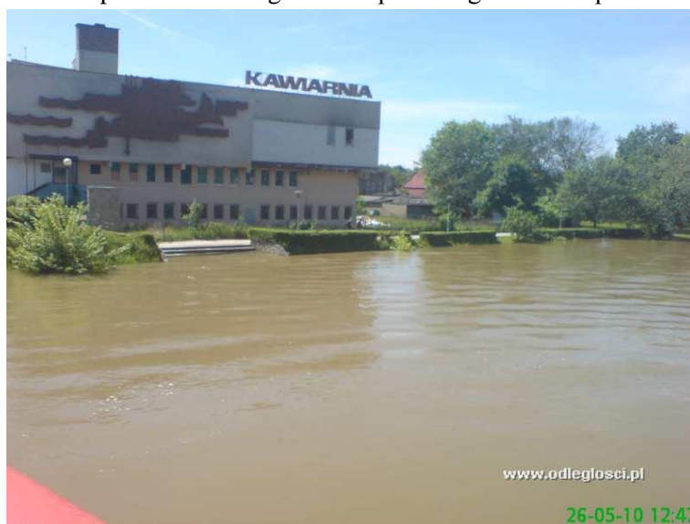
Fot. 4. Widok na dolną część miasta Krosno Odrzańskie podczas powodzi w 2010 r.

Budowa wałów przeciwpowodziowych jest kluczowa dla podejmowania jakichkolwiek działań konserwatorskich w tej części miasta. Zaniechanie ich budowy przy jednoczesnym nakładzie środków finansowych na renowację zabytków może stanowić ryzyko ponownej utraty wartości historycznej tkanki miejskiej.