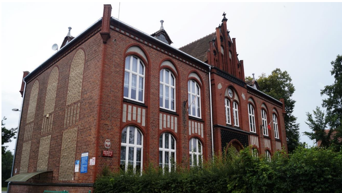
Fot. 1. Zespół szkolno – przedszkolny w Krośnice Odrzańskim