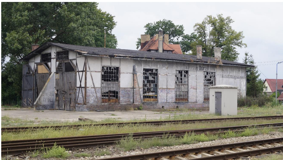
Fot. 2. Parowozownia przy ul. Dworcowej