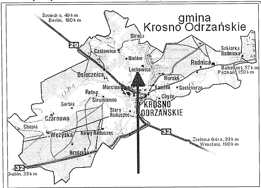
Rys. 1 – Lokalizacja miejscowości Łochowice na terenie gminy Krosno Odrzańskie

Miejscowość Łochowice położona jest w środkowej części województwa lubuskiego, w powiecie krośnieńskim, w gminie Krosno Odrzańskie. Łochowice jest jednym z 19 sołectw wchodzących w skład gminy. Przez miejscowość przebiega droga powiatowa relacji Krosno Odrzańskie – Bytnica w kierunku na Świebodzin. Wieś oddalona jest o 2 km od miasta Krosno Odrzańskie, będącego siedzibą samorządów gminnego i powiatowego. Powierzchnia gminy Krosno Odrzańskie wynosi 21.240 ha, z czego powierzchnia Łochowic stanowi 1.164 ha.