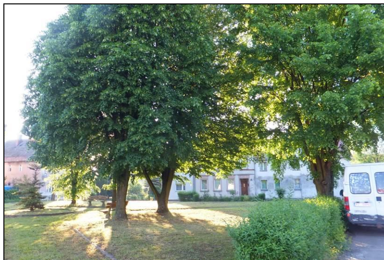
Fot. 8 Skwer przy ul. Żeromskiego