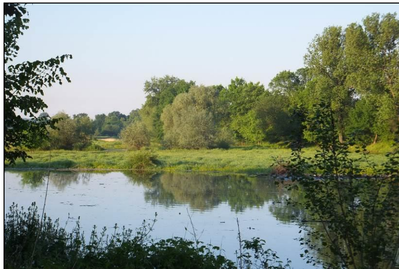
Fot. 7 Widok na południowy brzeg Starej Odry, widoczne dawne ujście Bobru, teren bardzo cenny pod względem przyrodniczym