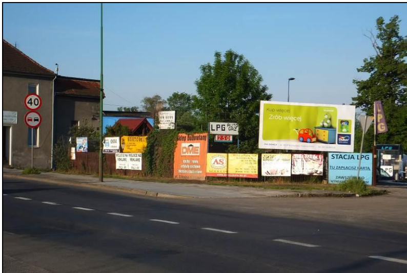
Fot. 14 Chaotycznie lokowane reklamy nie wpływają na pozytywne postrzeganie krajobrazu, tu rejon ul. Żymierskiego