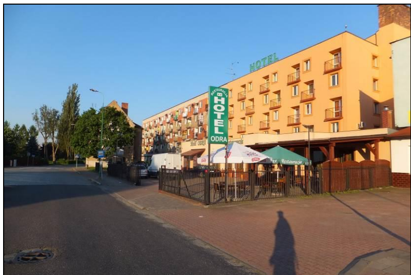
Fot. 1 Północna część obszaru, rejon ul. 22 lipca