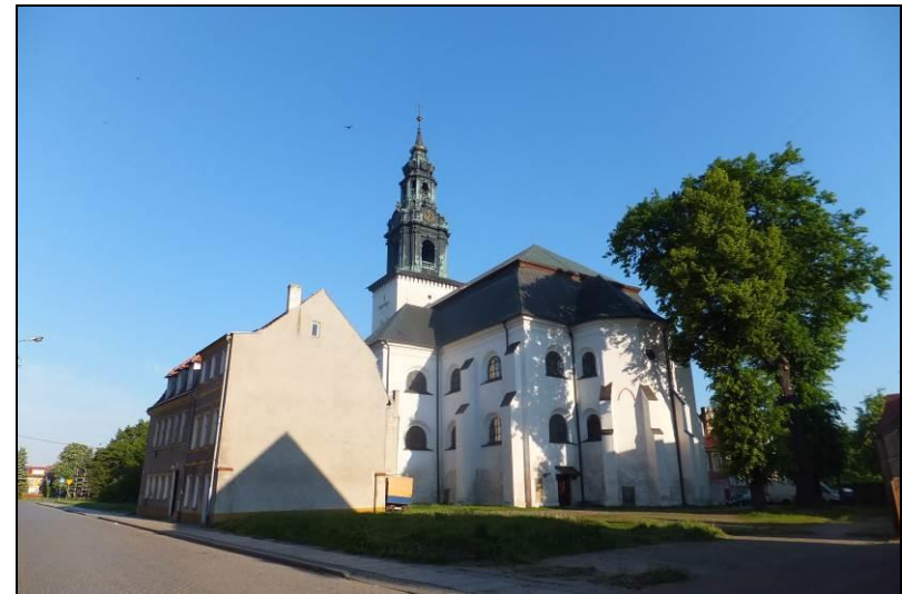
Fot. 16 Kościół p.w. Św. Jadwigi