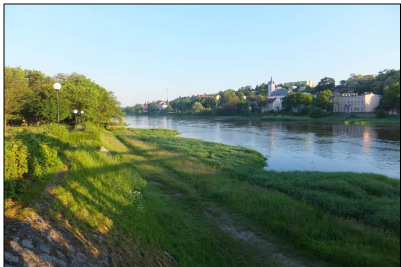
Fot. 3 Odra, widok z mostu w kierunku zachodnim