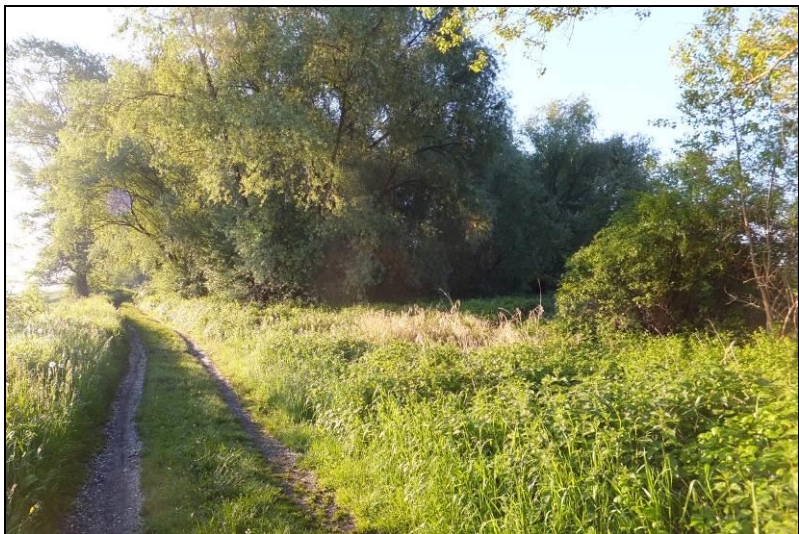
Fot. 5 Zadrzewienia o charakterze łągowym u zbiegu Odry i Starej Odry