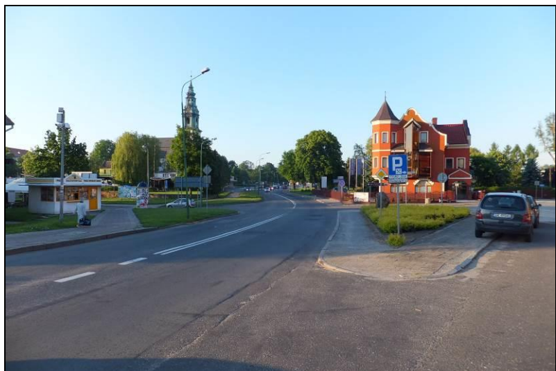
Fot. 2 Północna część obszaru, widok na ul. Ariańską