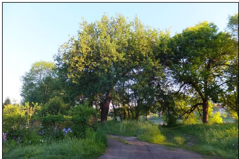
Fot. 4 Nadbrzeżne zadrzewienia nad Odrą, północno-zachodnia część terenu