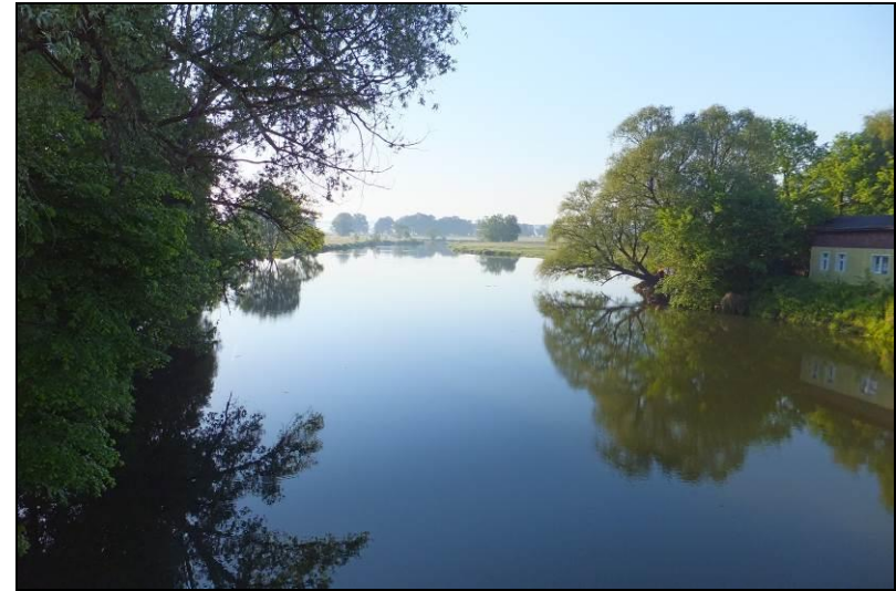
Fot. 15 Widok na Starą Odre