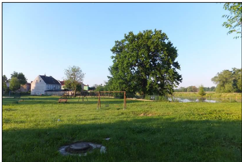
Fot. 9 Skwer z placem zabaw przy ul. Bobrowej