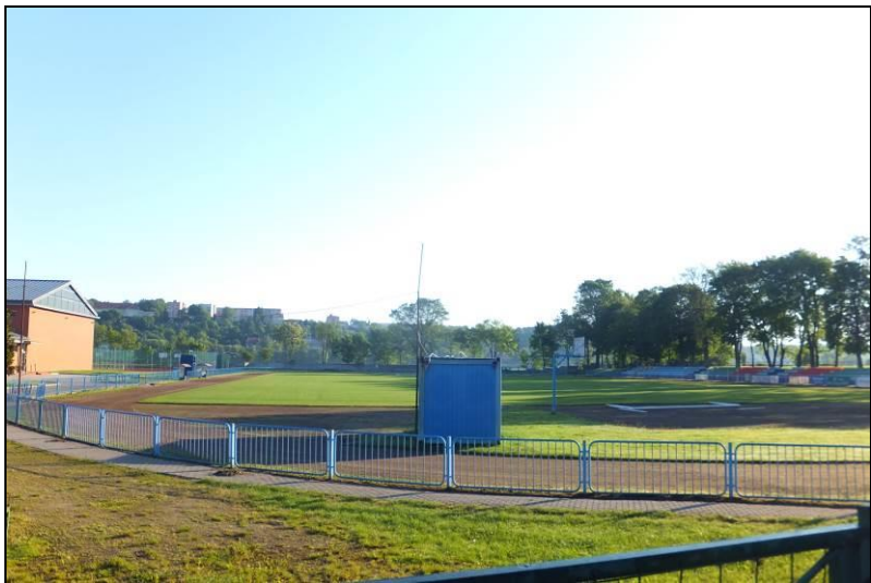
Fot. 17 Tereny sportowo-rekreacyjne w zachodniej części obszaru