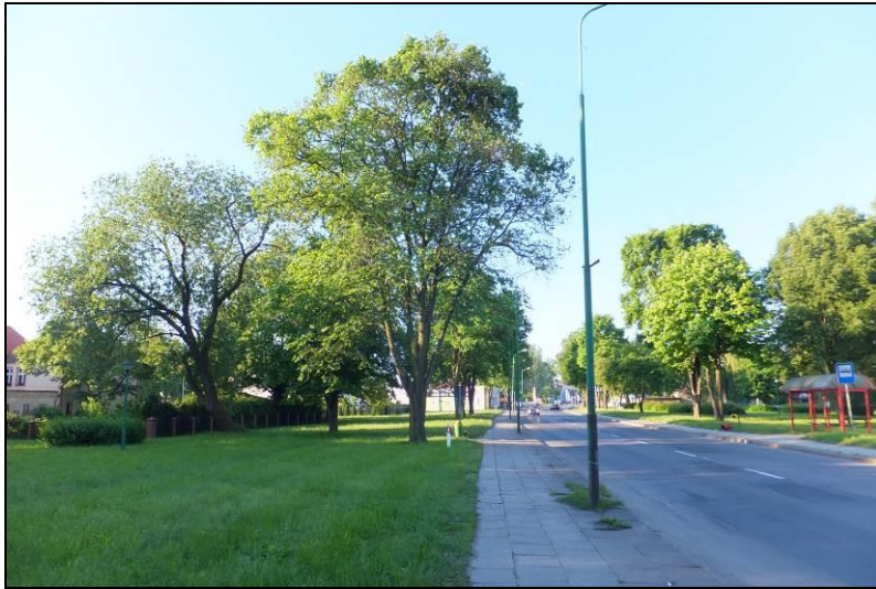
Fot. 13 Park po wschodniej stronie DK29