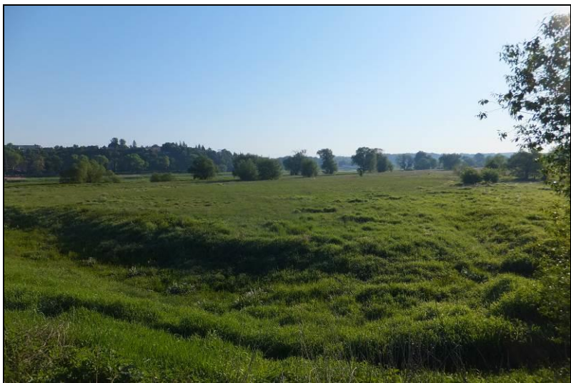
Fot. 18 Rozległe, podmokłe łąki we wschodniej części obszaru