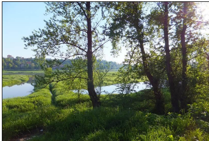
Fot. 19 Widok na oczka wodne w północno-wschodniej części obszaru, tereny cenne pod względem przyrodniczym