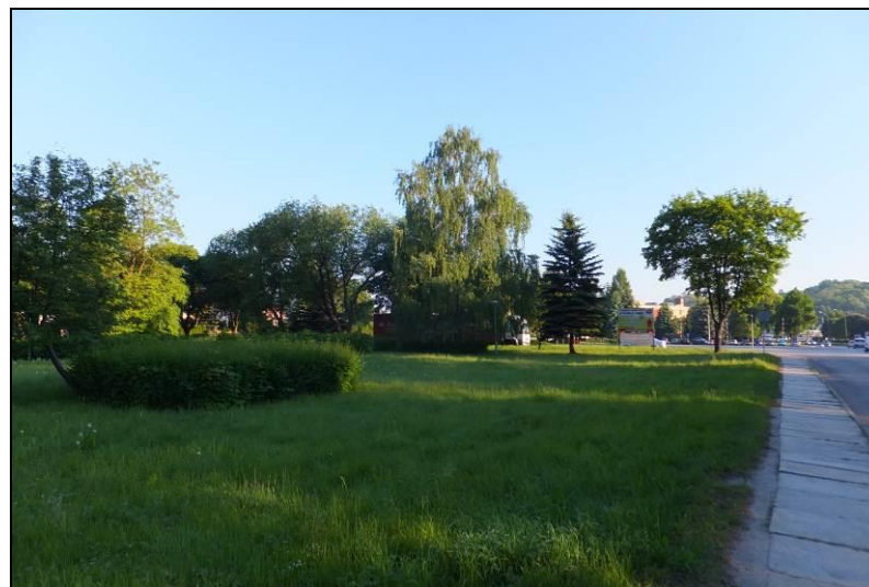
Fot. 11 Park po zachodniej stronie DK29