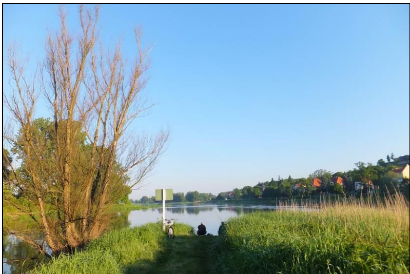
Fot. 6 Połączenie Odry i Starej Odry