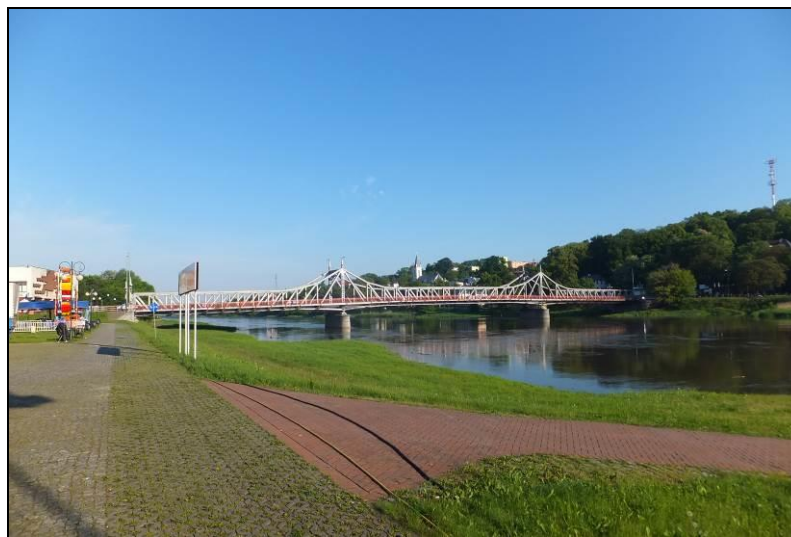
Fot. 20 Bulwar Jana Pawła II i most nad Odrą, północna część obszaru