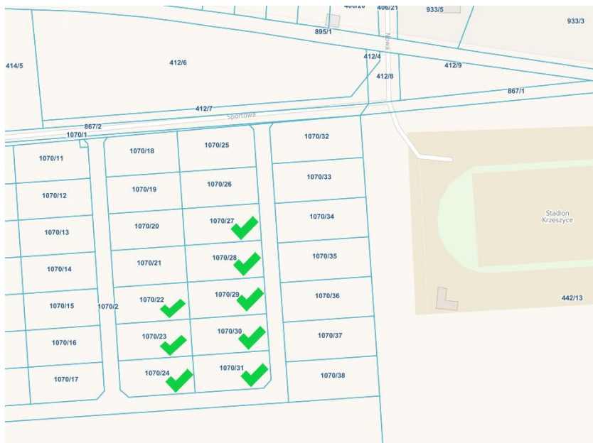
Działki 1070/22, 1070/23, 1070/24, 1070/27, 1070/28, 1070/29, 1070/30, 1070/31

Ogłoszenie o przetargu zostało wywieszane na tablicy ogłoszeń w budynku urzędu oraz na stronie internetowej http://www.infopublikator.pl oraz w BIP adres https://bip.wrota.lubuskie.pl/ugkrzeszyce/