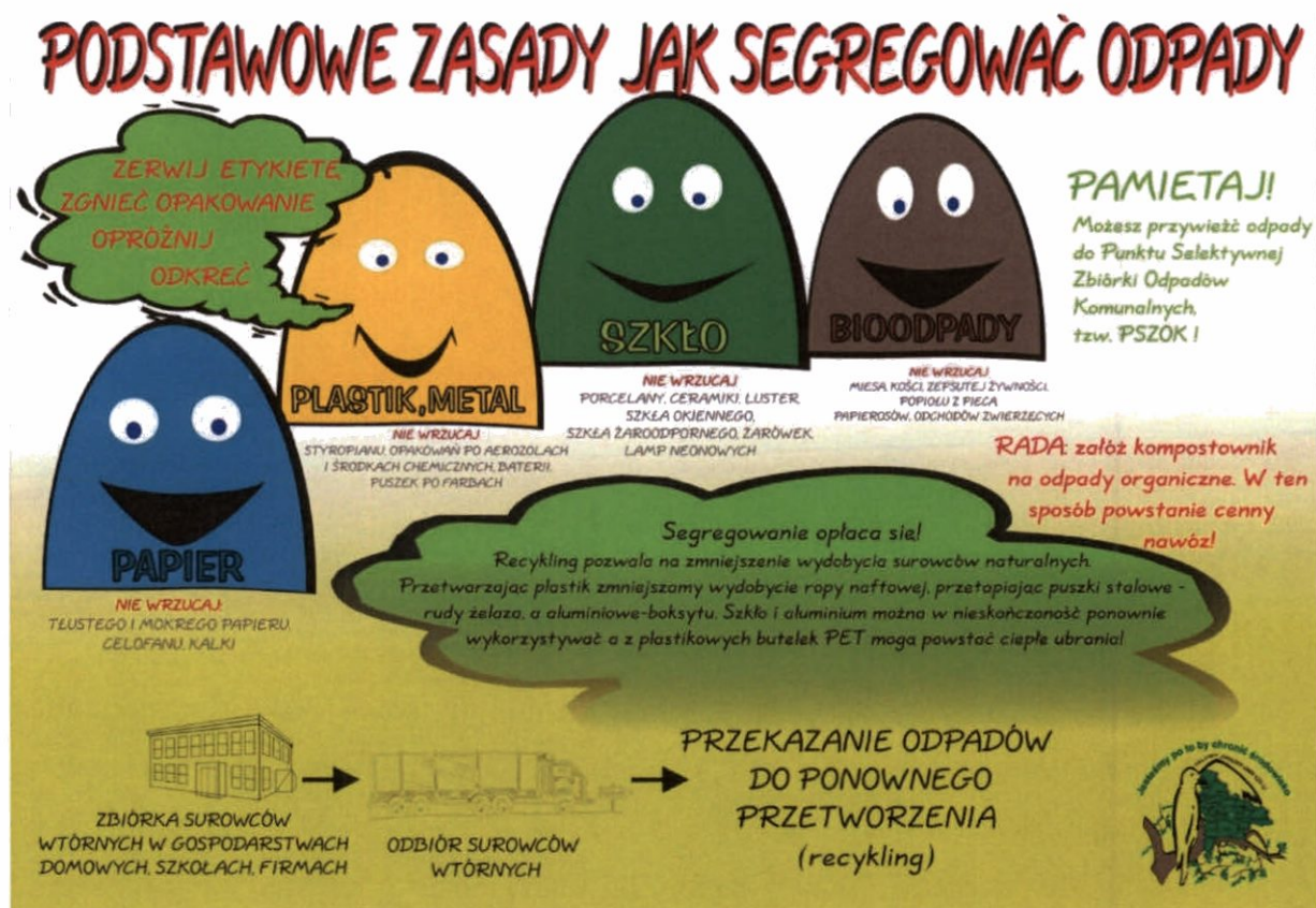
Rysunek 1. Zasady segregowania odpadów.