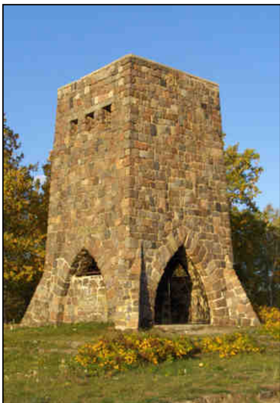
Rys. 9. Wieża widokowa Ośnie Lubuskim

Ponadto na terenie Gminy, w poszczególnych miejscowościach, znajdują się kościoły z okresu średniowiecza a także palace i dwory wpisane do rejestru zabytków.