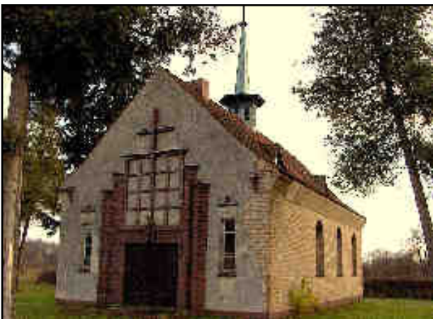
Rys. 7. Kościół pw. Podniesienia Krzyża przy ul. Aleja Pokoju

Na cmentarzu znajduje się późnogotycka kaplica św. Gertrudy, pochodząca z XIV wieku. Interesującym zabytkiem jest również kościół filialny p.w. Podwyższenia Krzyża Świętego przy ulicy Aleja Pokoju, kaplica grobowa na cmentarzu przy kaplicy św. Gertrudy przy ulicy Słubickiej a także macewy z dawnego cmentarza żydowskiego. Na uwagę zasługuje także gmach dawnego Seminarium Nauczycielskiego (obecnie Liceum Ekonomiczne) przy ulicy Rzepińskiej, gmach internatu przy ulicy Rzepińskiej oraz wieża widokowa.