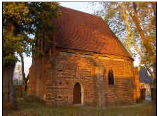
Rys. 8. Kaplica św. Gertrudy przy ul Słubickiej