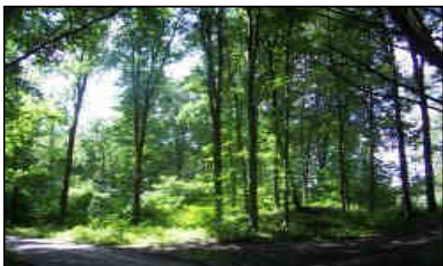
Rys. 1. Lasy Uroczyska Doliny Lenki.