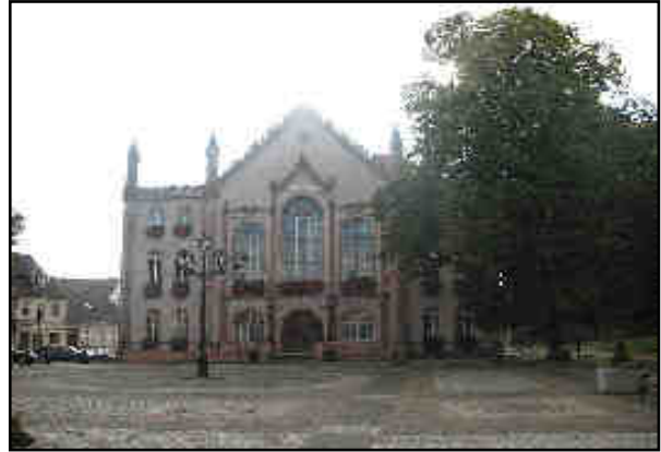
Rys. 6. Ratusz – Urząd Miejski w Ośnie Lubuskim

Na cmentarzu znajduje się późnogotycka kaplica św. Gertrudy, pochodząca z XIV wieku. Interesującym zabytkiem jest również kościół filialny p.w. Podwyższenia Krzyża Świętego przy ulicy Aleja Pokoju, kaplica grobowa na cmentarzu przy kaplicy św. Gertrudy przy ulicy Słubickiej a także macewy z dawnego cmentarza żydowskiego. Na uwagę zasługuje także gmach dawnego Seminarium Nauczycielskiego (obecnie Liceum Ekonomiczne) przy ulicy Rzepińskiej, gmach internatu przy ulicy Rzepińskiej oraz wieża widokowa.