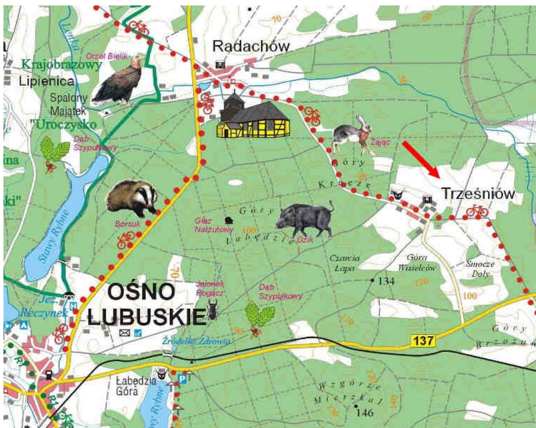
Mapa 2. Położenie miejscowości Trześniów.

Na terenie miejscowości zachował się park podworski z początku XIX wieku o powierzchni 4,10 ha. Drzewostan tworzą głównie gatunki rodzime, a do wyróżniających się drzew zaliczany jest buk odmiany purpurowej, dąglezja zielona oraz klon jesionolistny. Wiek drzew określa się na 110–130 lat, pojedyncze z nich mogą być starsze. Niestety park niszczy w związku z ograniczonymi możliwościami finansowymi i brakiem inwestycji w obszarze parku.