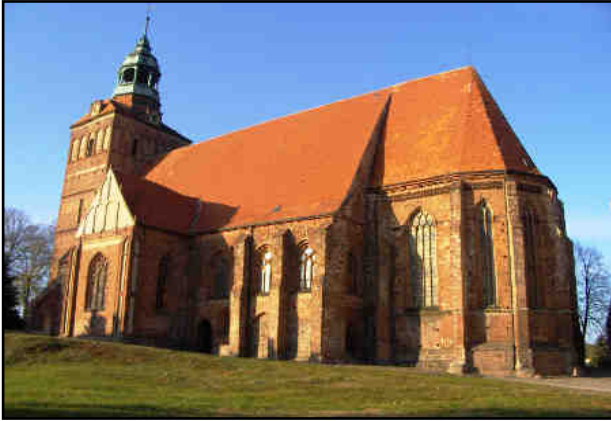
Rys. 5. Kościół pw. św. Jakuba w Ośnie Lubuskim

Neogotycki ratusz z 1833 r. stoi na miejscu starszego gotyckiego ratusza z 1544 r.