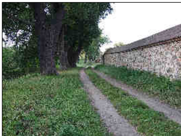
Rys. 3. Mury obronne-widok w kierunku ul. Wodnej Rys. 4. Mury obronne-widok w kierunku ul. Ogrodowej.