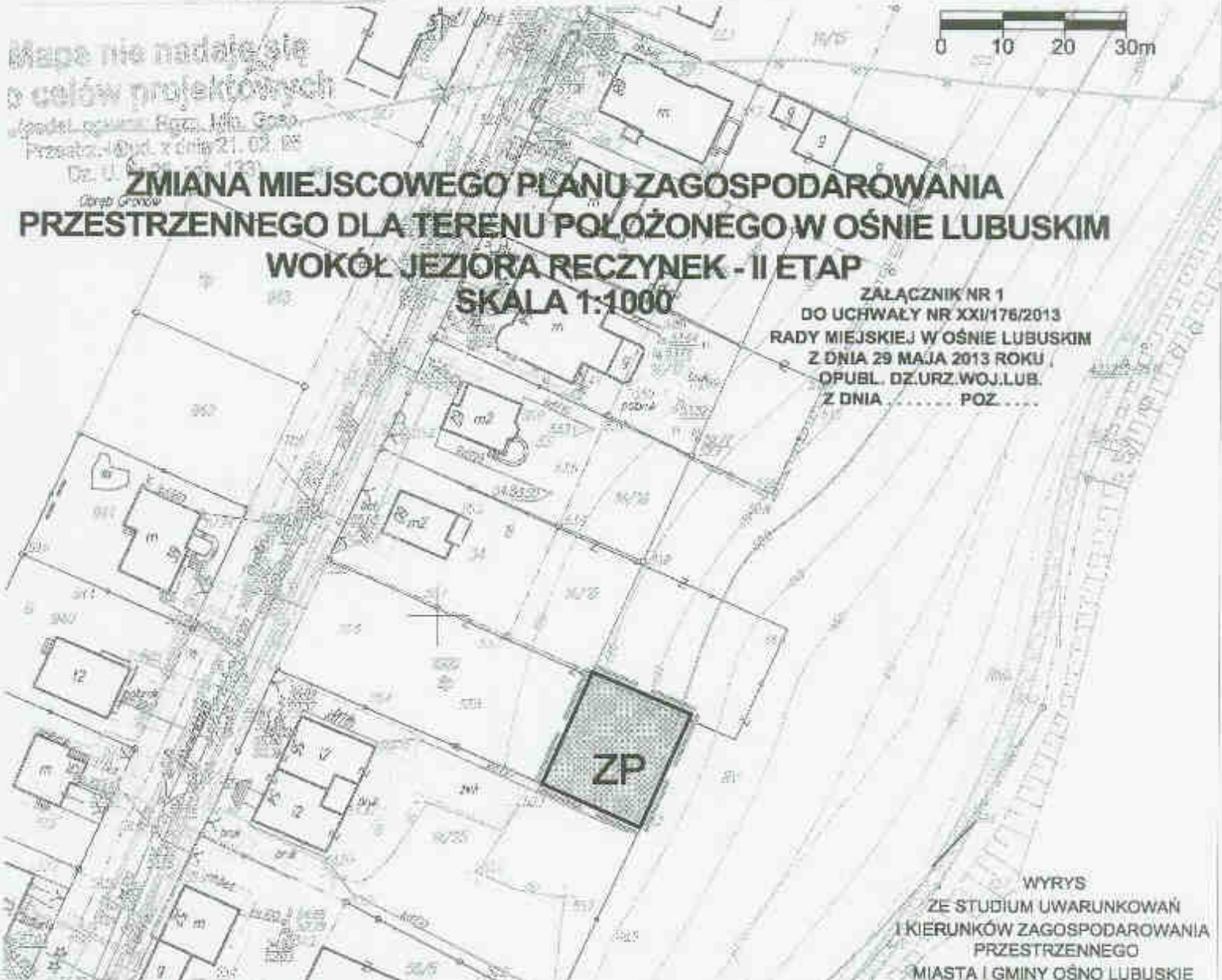
WYRYS ZE STUDYUM UWARUNKOWAŃ I KIERUNKÓW ZAGOSPODAROWANIA PRZESTRZENNEGO MIASTA I GMINY OŚNO LUBUSKIE