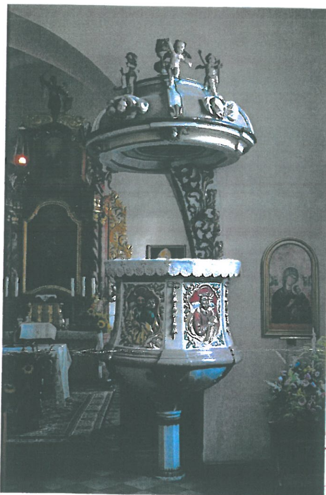
Fot. 1 XVII – wieczna ambona z kościoła św. Jakuba w Niedoradzu.

WOJEWÓDZKI URZĄD UCHRONY ZABYTEKÓW w ZIELONEJ GÓRZE Zielona Góra, ul. Kopernika 1 65-324 73 90, 65 324 73 11 tel./fax 68 325 37 45