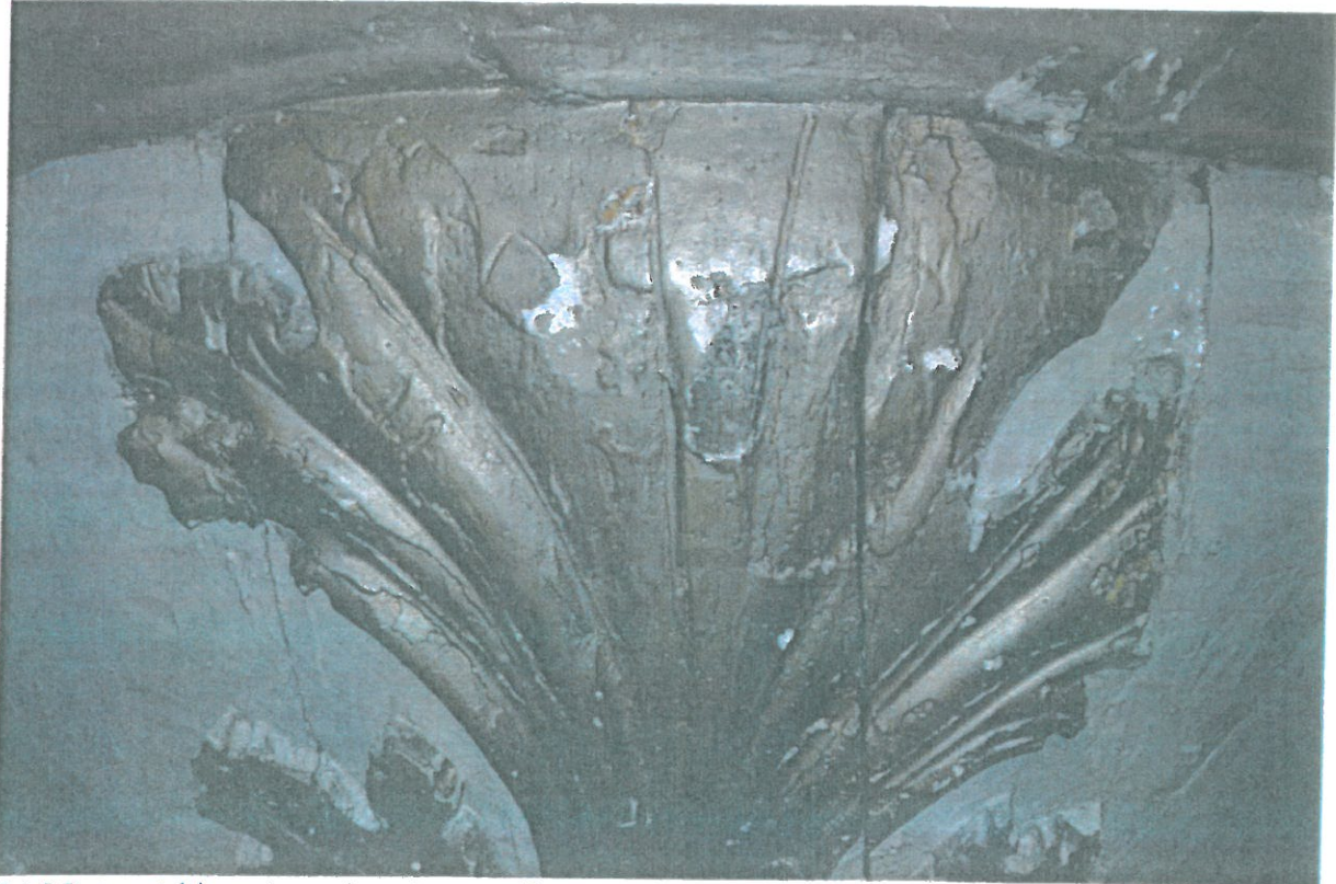
Fot. 5 Fragment dekoracyjnego elementu snycerskiego w postaci wici roślinnej u spodu kosza ambony. Widoczne liczne ubytki formy oraz niechlujne nawarstwienia farb i złocień.