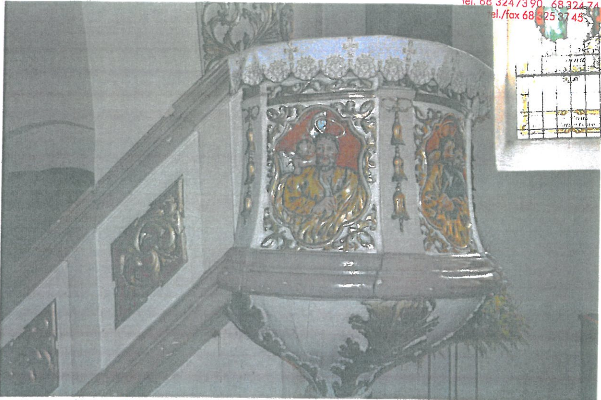
Fot. 4 Kosz ambony z widocznymi wizerunkami Apostołów oraz wtórnie złożonymi dekoracjami w formie wici roślinnych i kampanuli. Widoczna także balustrada pełna z płytkami w kształcie rombów zdobiona dekoracjami w kształcie wici roślinnych.