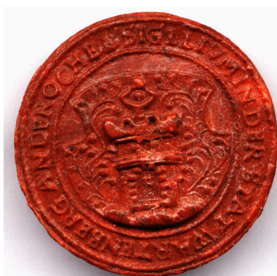
Pieczęć herbowa Otynia z XVII wieku, Archiwum Państwowe w Zielonej Górze

Najtrwalszym symbolem, jak już zostało podkreślone okazał się herb miejski, który przez stulecia widniał na pieczęciach miejskich. W zbiorach zielonogórskiego Archiwum Państwowego zachował się odcisk pieczęci Otynia wykonany w czerwonym wosku z XVII wieku z napisem wokół herbu: SIGILLUM IN DER STAT WARTNEBREG AN DER OCHEL.