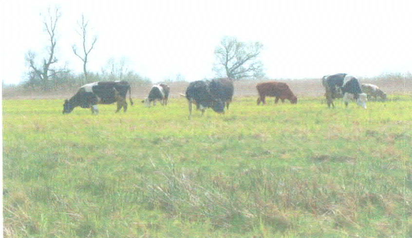
Bydło na nadwarciańskich pastwiskach w sołectwie Świerkocin.

Pozostali mieszkańcy swoje główne dochody czerpią w działalności pozarolniczej. W miejscowości Świerkocin jest 50 budynków mieszkalnych.