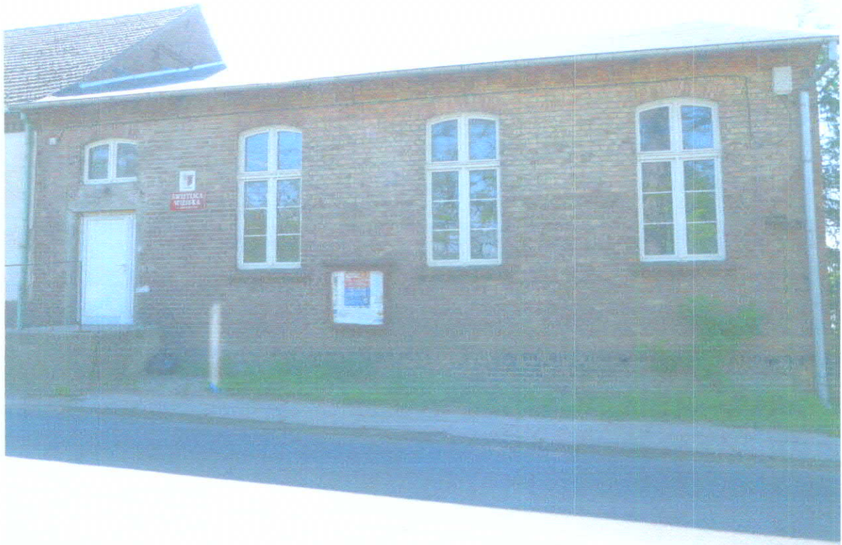
Świellica wiejska w Świerkocinie.

Poniższe dwa zdjęcia przedstawiają obiekty Regionalnego Zarządu Gospodarki Wodnej w Poznaniu. Zdjęcie przedstawia widok od strony Warty. Na brzegu tym planowane jest wybudowanie stacji. Poniżej widok obiektu od strony drogi wojewódzkiej nr 131.