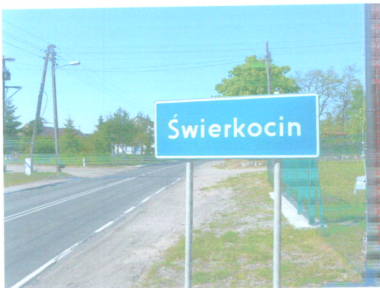
Wjazd do Świerkocina od strony Nowin Wielkich odległych o ok. 1 km.

Świerkocin (przedwojenna nazwa Fichtwerder) to wieś leżąca na południowym krańcu gminy Witnica, położona nad rzeką Wartą, przecięta przez drogę wojewódzką nr 131.