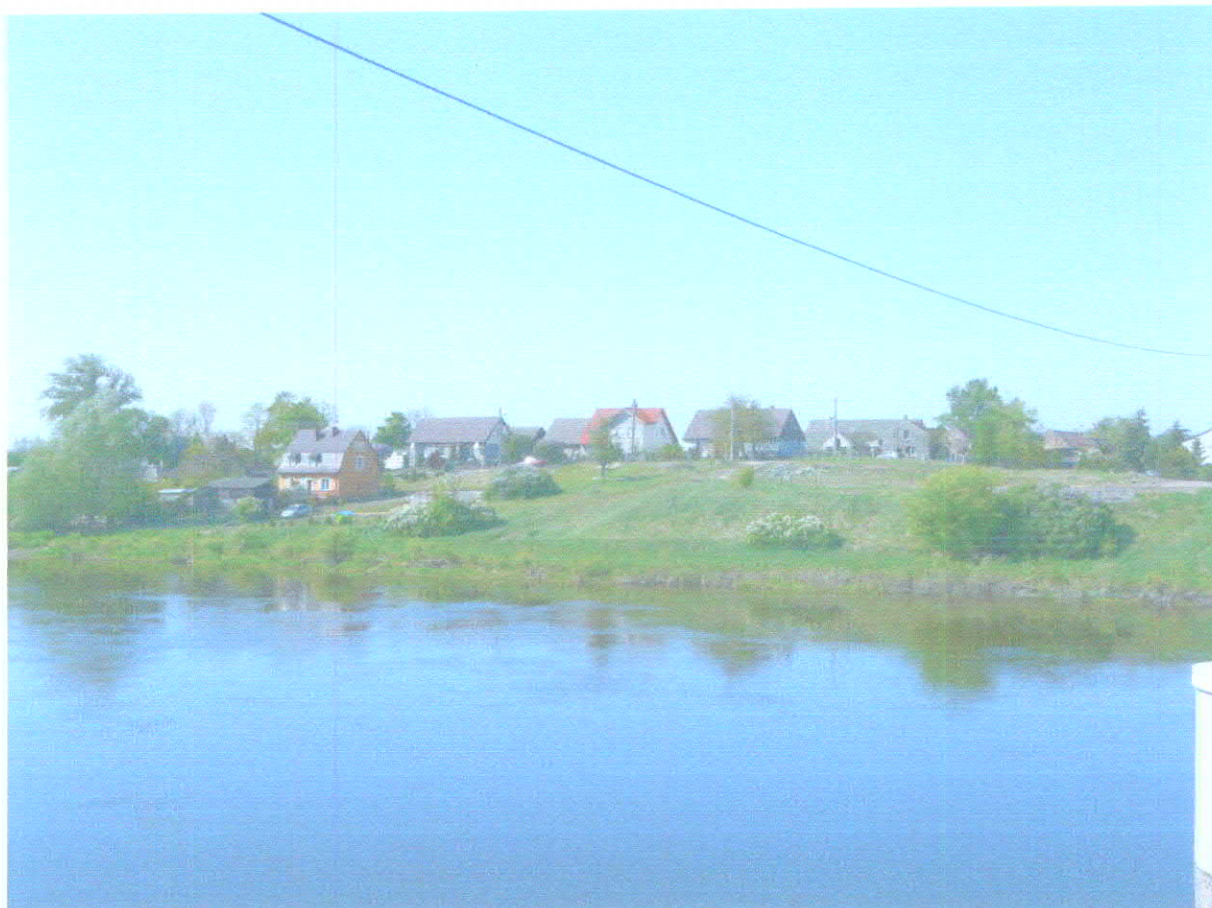
Wieś Świerkocin widok od strony Warty.

Wyjątkowe walory przyrodnicze, bardzo dobry układu komunikacyjny oraz położenie w pobliżu ośrodków miejskich wyposażonych w bazę hotelową (Gorzów Wlkp., Witnica) stwarzają w Świerkocinie doskonałe warunki do rozwoju turystyki związanej z ekologią i ochroną przyrody.