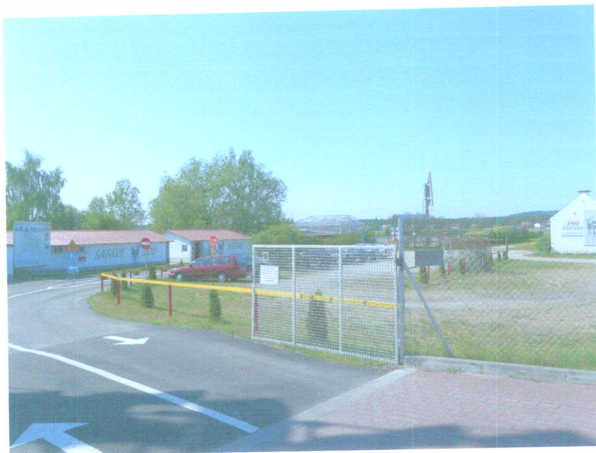
Wjazd do zoo safari w Świerkocinie.