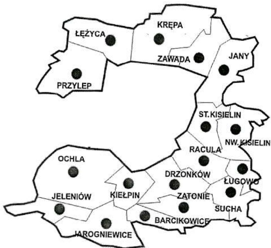
Mapa nr 2, Obszar sołectwa Ochla na tle pozostałych miejscowości Gminy

Wieś jest wielodrożnicą, o bardzo rozbudowanej sieci dróg, z których znaczna część pokryta jest zabytkowym brukiem.