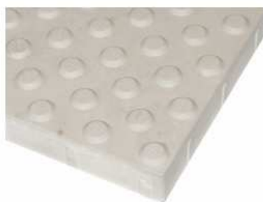
Rys. 2a. Płytki ostrzegawcze – szczegół powierzchni