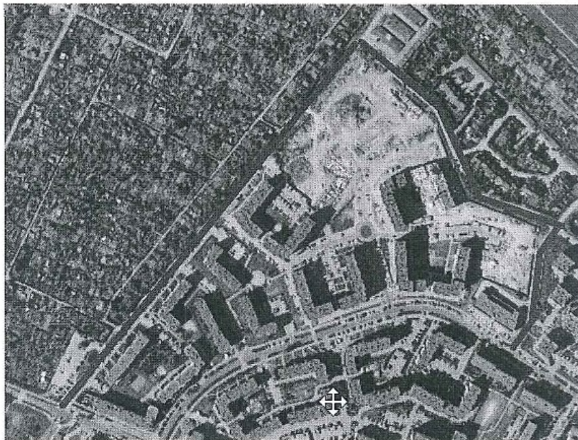
Rys 1. Górczyn, ulice Okulickiego, Sosabowskiego, Starzyńskiego