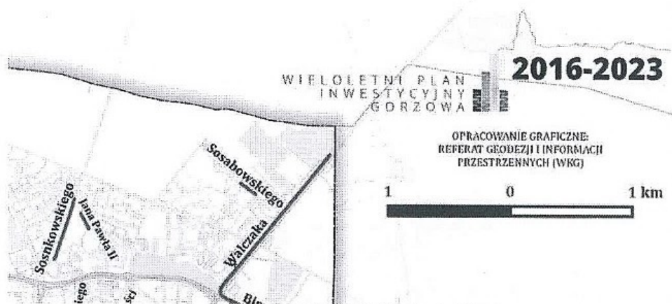
Rys 2. WPI 2016-2023, strona 11

Ulice te posiadają ograniczenia dla ruchu ciężarowego (dopuszczony dla służb miejskich i pojazdów z zezwoleniem), jednakże postępująca budowa przyczyniła się do ich znacznej degradacji. Nie znalazły się one też w Wieloletnim Planie Inwestycyjnym na lata 2016-2023, co pozwala przypuszczać, że stosowne umowy z Inwestorem zostały zawarte i są przedmiotem niniejszego zapytania.