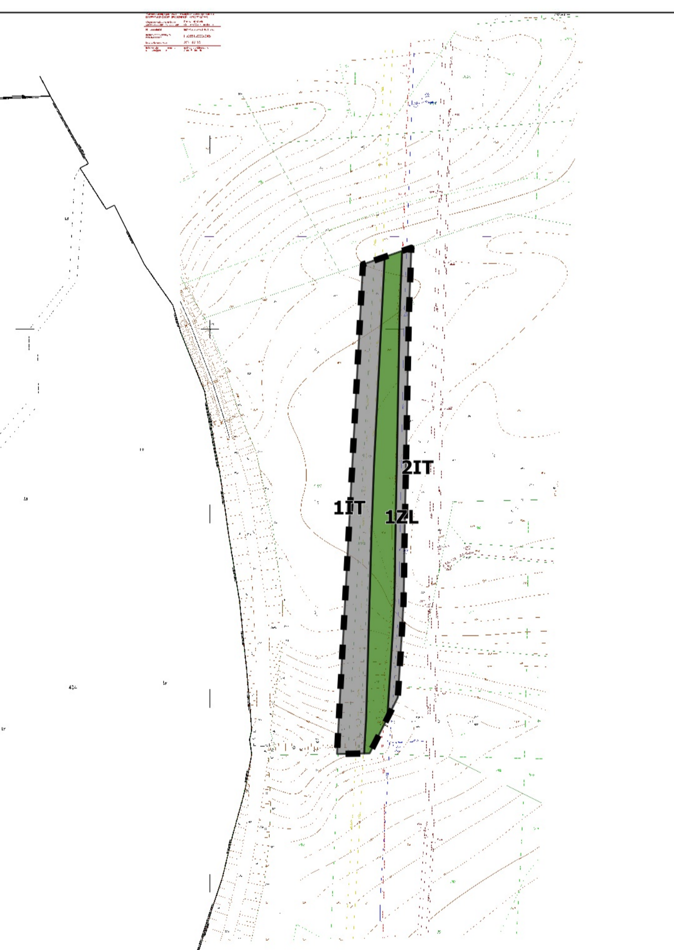
Wyrys ze Studium uwarunkowań i kierunków zagospodarowania przestrzennego miasta Gorzowa Wielkopolskiego