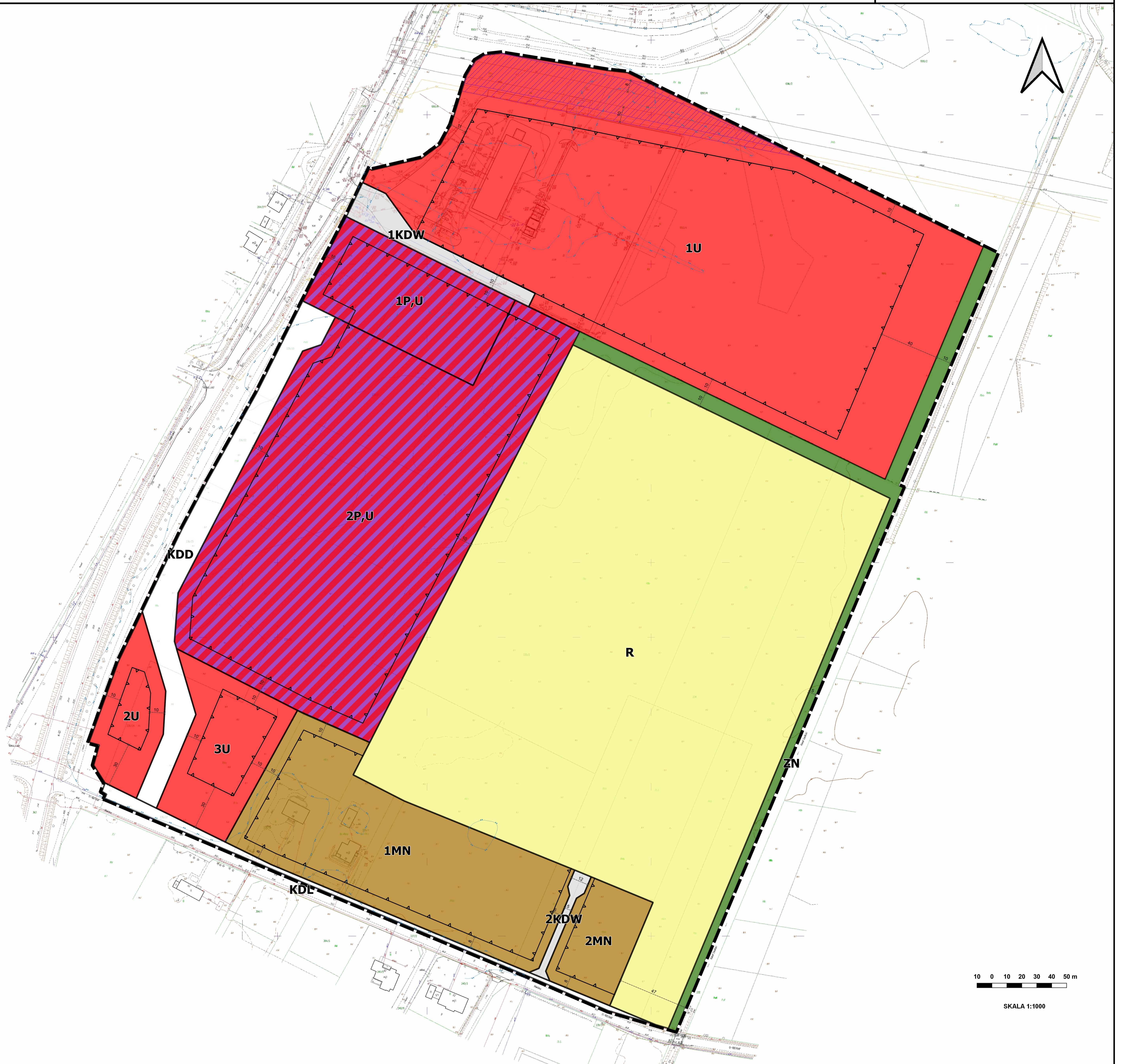
Wrys ze Studium uwarunkowań i kierunków zagospodarowania przestrzennego miasta Gorzowa Wielkopolskiego (Uchwała Rady Miasta Gorzowa Wielkopolskiego Nr XXXIV/602/2021 z dnia 24 lutego 2021 r.)

Załącznik Nr 1 do uchwały Nr XLII/722/2021 Rady Miasta Gorzowa Wielkopolskiego z dnia 29 września 2021 r.